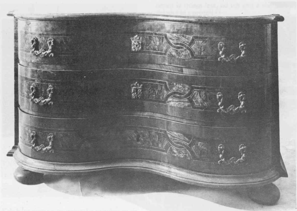
Predalnik, furnir iz orehove korenine, orehovine, javorovine in hrastovine, medeninasto okovje, sreda 18. stoletja, Narodni muzej, Ljubljana