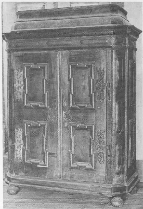
Garderobna omara, temno lužen les, pokositreno železno okovje, konec 17. stoletja, z gradu Pukštanj pri Dravogradu, Narodni muzej, Ljubljana