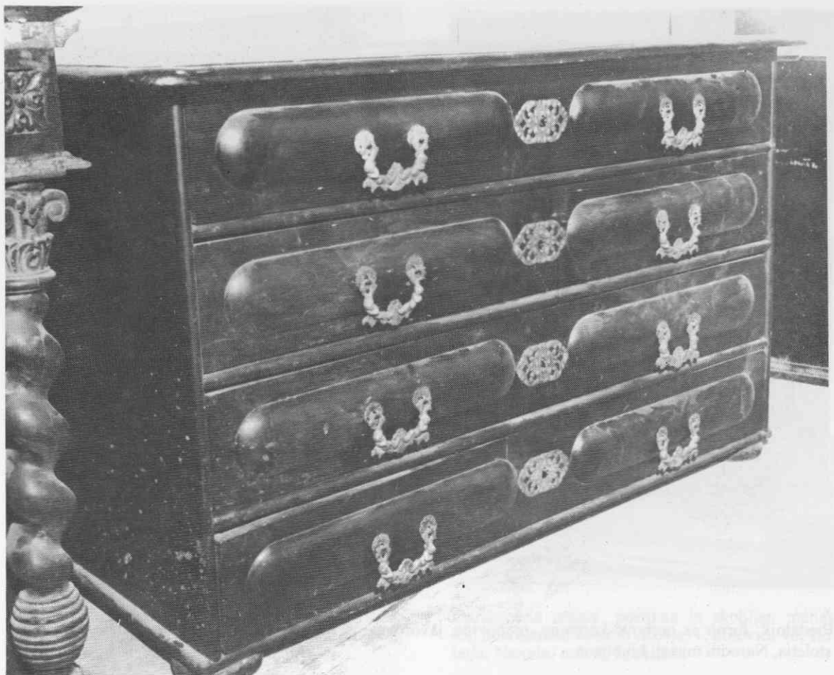
Predalnik, črno politiran les, medeninasto okovje, 1. četrtina 18. stoletja, Narodni muzej, Ljubljana

torej furnirane, z »rumenim«, torej medeninastim okovjem, pogosto se kot konstrukcijski sestavni del omenja tudi pult. Povprečno so imele graščine po eno ali največ tri tabernakeljske omare. Od približno leta 1760 naprej se v popisih imenujejo »pultne omare«.