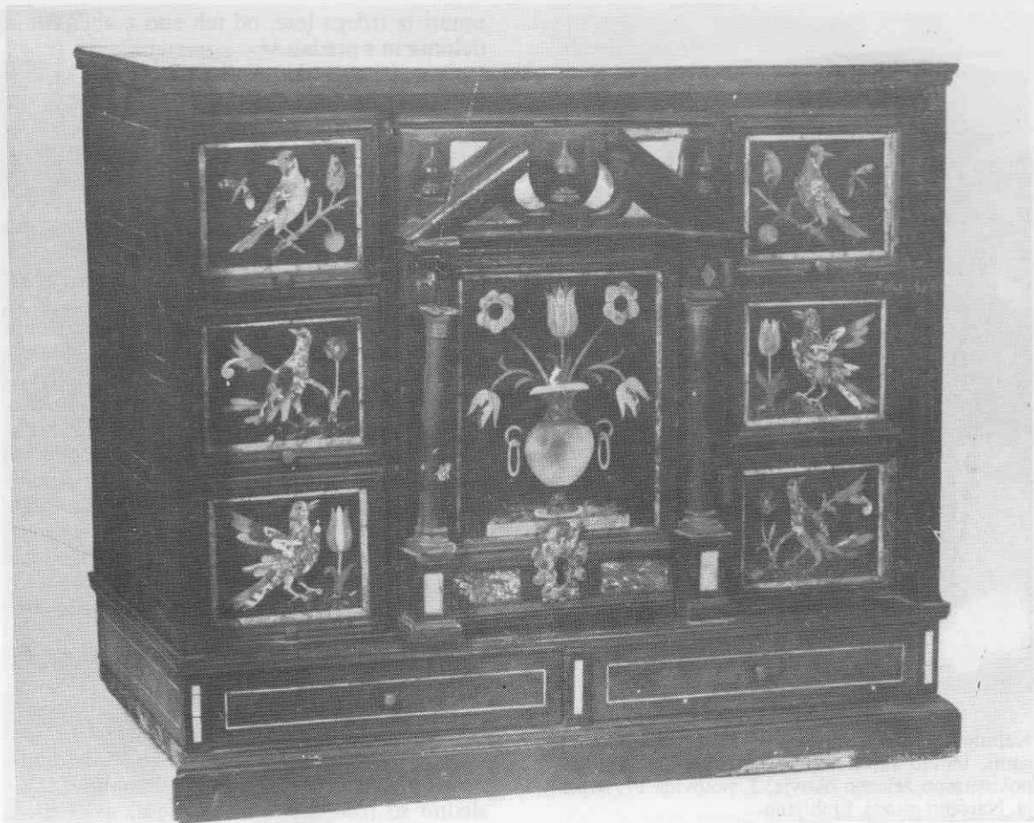
Kabinetna omarica iz temno luženega lesa z vloženi raznobarni kamni v pietra dura tehniki, 2. polovica 17. stoletja, zgodnji barok, Narodni muzej, Ljubljana