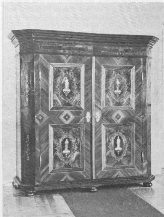
Garderobna omara, orehov, javorov, hrastov furnir, medeninasto okovje, 2. polovica 18. stoletja, Narodni muzej, Ljubljana

bile iz trdega lesa, furnirane in z »rumenim«, torej medeninastim okovjem (zlato barvo ima tudi v ognju zlačeno bronasto okovje, ki ga inventarji le redko omenjajo, pa tudi na ohranjenih kosih ga skoraj ne najdemo). Vzporedno s tem dražjim so precej uporabljali tudi pohištvo, narejeno iz mehkega lesa. Skrinje se omenjajo le v manjšem številu. Zdaj so bile dosledno postavljene v stranske prostore, v veže, kuhinjske prostore in v prostore za služničad.