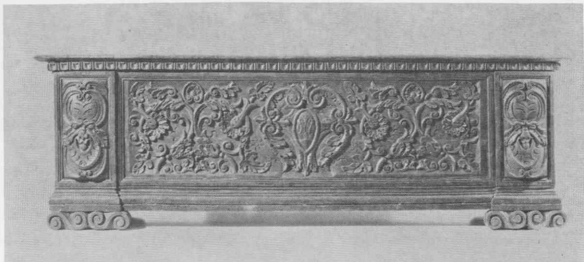
Skrinja iz rezljane orehovine z manieristično in zgodnjebaročno ornamentiko, pozno 17. stoletje, Narodni muzej, Ljubljana