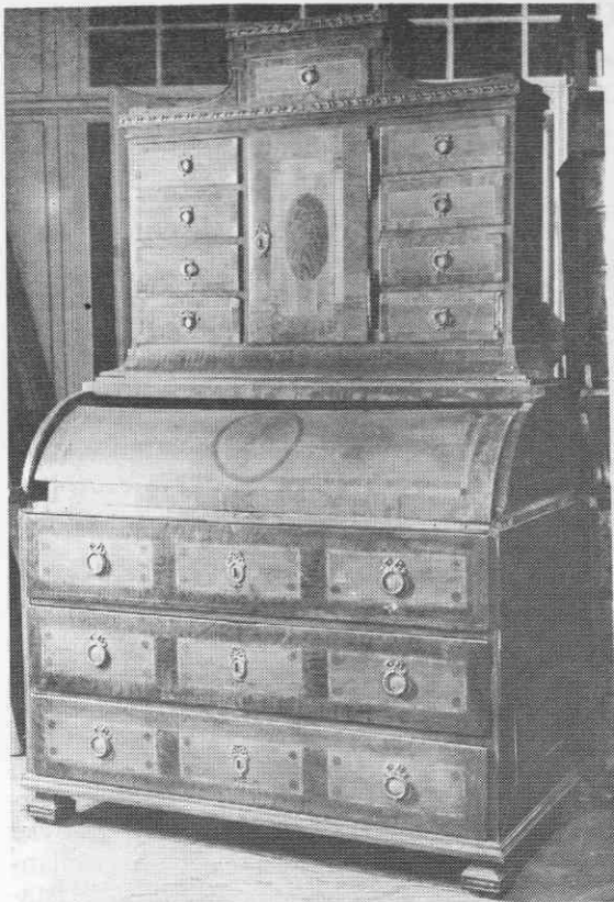
Tabernakeljska omara, orehov in javorov furnir, medeninasto okovje, konec 18. stoletja, klasicizem, Narodni muzej, Ljubljana

majhen nastavek iz trdega lesa in z vložki s sedmimi predali, poslikano štirioglato omaro iz trdega lesa, tri različne velike poslikane omare za obleke iz mehkega lesa, različno velike točilne omare, komode itd. 26