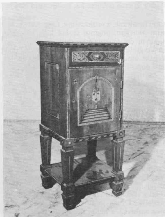
Nočna omarica, češnjev les z jedrno intarzijsko iz več vrst lesa, konec 18. stoletja, klasicizem, Narodni muzej, Ljubljana

Črno luženo pohištvo je v tretji četrtini 18. stoletja označeno v inventarjih kot staro, torej nemoderno, čeprav so bili črno luženi predalniki še precej pogosti. Večina drugega shrambenega pohištva, omare za obleko in perilo, za posodo, za orožje (zastekljene), pisalne omare, shrambene omare, predalniki, pultne omare (= tabernakeljske omare) in knjižne omare so