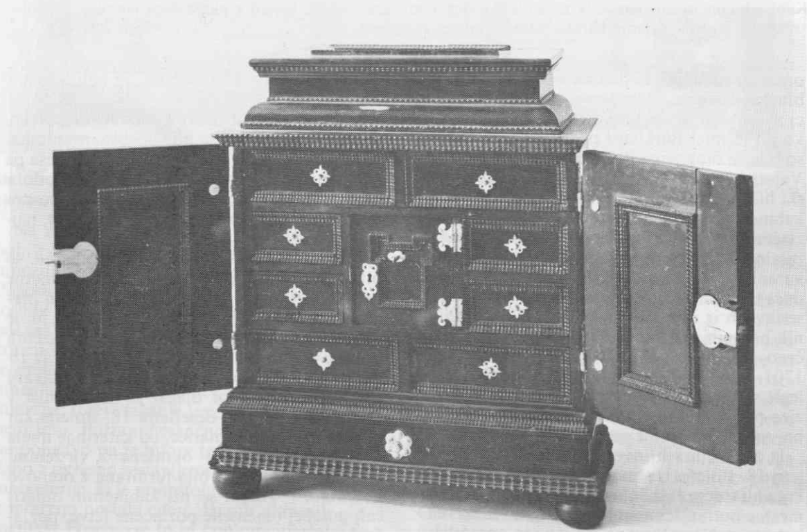
Kabinetna omarica, črno politiran stružen in skobljan les, pokositreno železno okovje, 2. polovica 17. stoletja, iz zbirke Karla Strahla v Stari Loki. Narodni muzej, Ljubljana