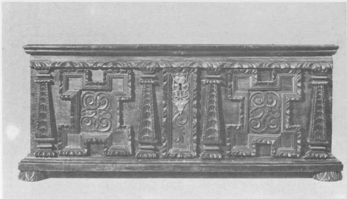
Skrinja iz rezljane orehovine z manieristično ornamentiko, 2. polovica 17. stoletja, iz zbirke Karla Strahla v Stari Loki, Narodni muzej, Ljubljana

razstavljeno namizno posodo iz kositra, majolike in srebra. V spalnici so bile postelja, ena ali dve mizi z nekaj stoli in omara. 2