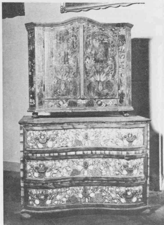
Predalnik z nastavkom, poslikan les, nalepljeni grafiki, medeninasto okovje, z Drnskega gradu pri Begunjah, 2. polovica 18. stoletja, Narodni muzej, Ljubljana