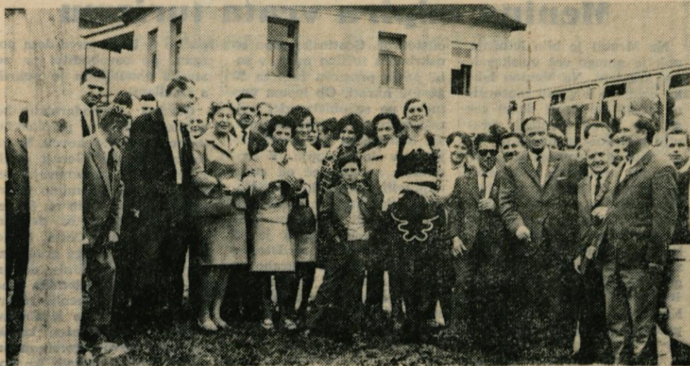
Kamničani so obiskali tudi spomenik II. srbske vstaje v Rudniku pri Milanovcu