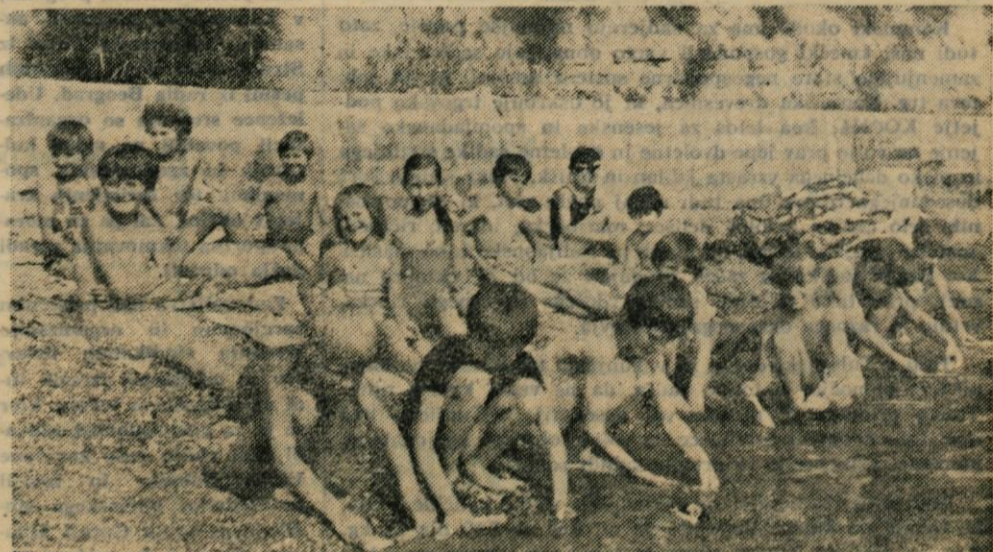
Res lepo je bilo na Debelem rtiču. Najraje bi kar ostali ob toplém morju. Prihodnje poletje se prav gotovo spet vidimo