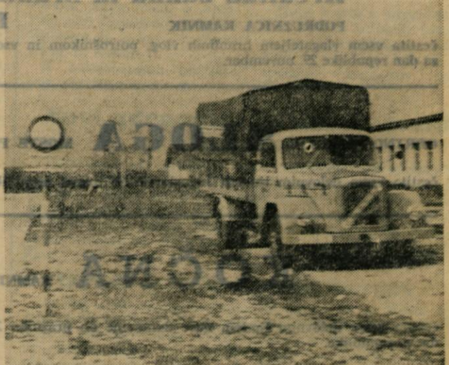
Namesto otroškega igrišča parkirni prostor? Stanovanjsko naselje v Zapricah verjetno tudi letos ne bo dočakalo otroškega igrišča, čeprav ima krajevna skupnost že dve leti denar za ta namen. Kdo je kriv?

skupščina ugotavlja, da je večina predlogov in pripomb občanov upoštevanih. Ne more pa upoštevati predloge glede obvozne ceste severno od naselja Most.