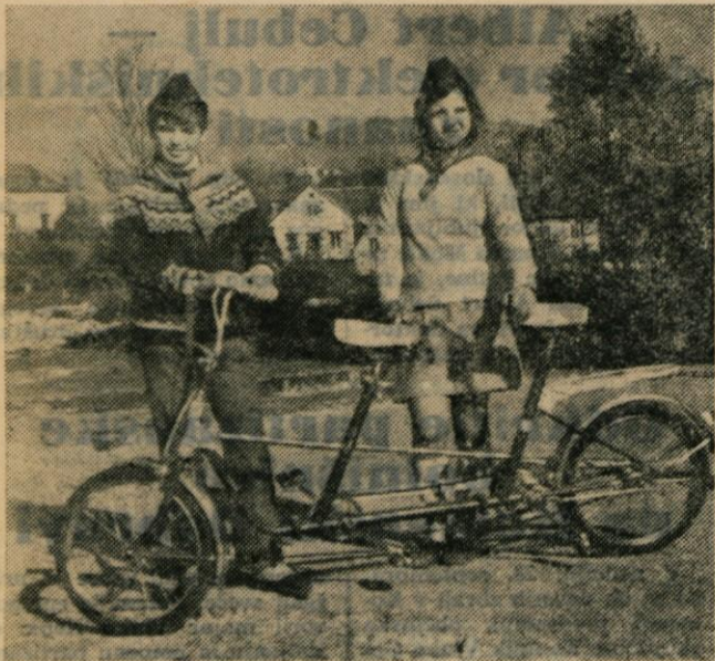
Dvosedežni pony: druga nagrada mladim kamniškim zgodovinarjem