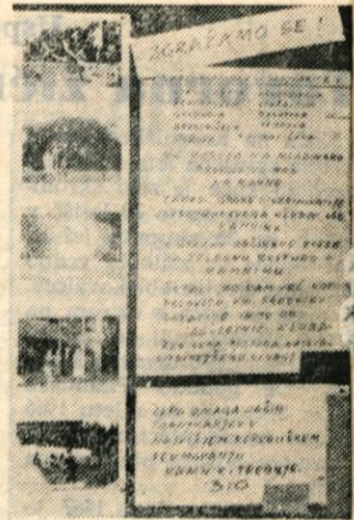
Protestiranje na prvem mestu?

Povedati moram, da me odbojkarji tri leta, kar sem predsednik, še niso povabili na občni zbor, nisem pa kriv, če strokovne službe občine