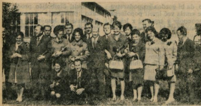
Zvesti Svilanitu od ustanovitve, sicer ne vsi, vendar tudi 12 let je lepa doba