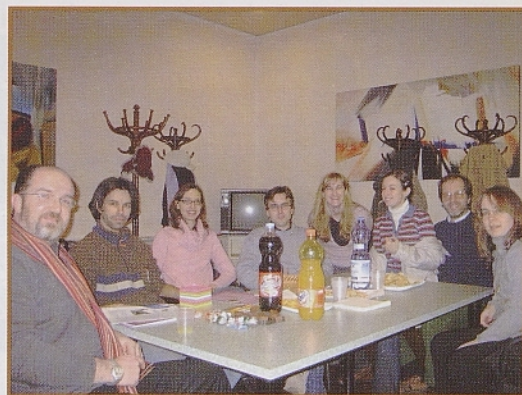
Zgoraj: debatni krožek.

publiko prvih treh razredov znanstvenega in klasičnega liceja France Prešeren. Ko smo zadnji trenutek še mrzlično ponavljali vloge, si nismo mogli kaj, da se ne bi spraševali kakšen bo odziv publike. Ko pa smo bili enkrat na odru in smo se uživali v vloge, smo končno pozabili na vse ostalo in se nekje na sredi igre nazadnje zavedali, da vlada v dvorani popoln mir in zanimanje. Z užitek smo odigrali svoje vloge in z veseljem sprejeli končni aplavz. Lepo je bilo odhajati iz dvorane med zadovoljnimi obrazi sošolcev in smehom ter odmevi vzklika: »Krištof Kolumb!«, ki ga v igri večkrat ponavlja glavna junakinja in ki je gledalce očitno zelo zabaval.