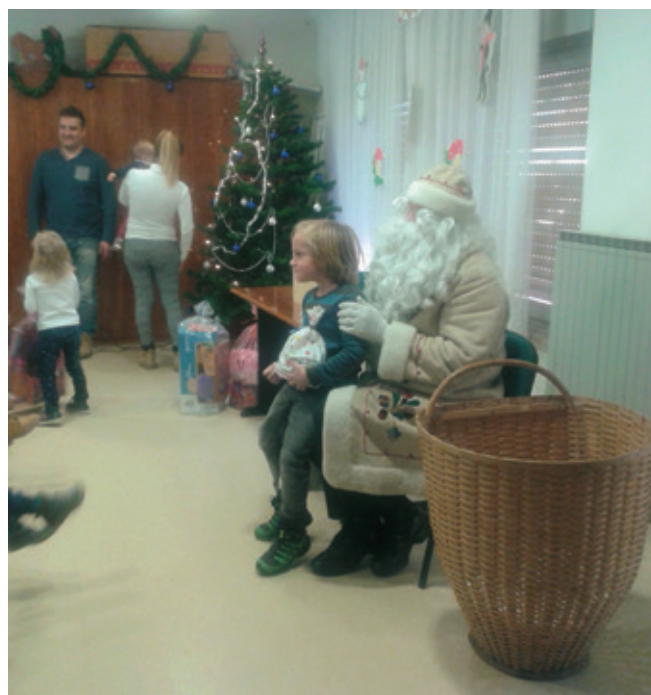
Še fotografija z Dedkom; koš pa že precej prazen