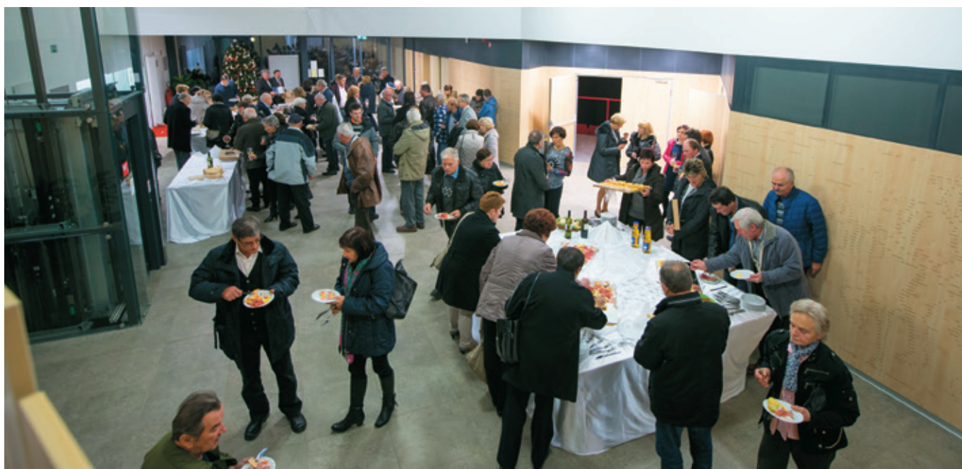
Dogodek se je zaključil s pogostitvijo in druženjem v preddverju Krpanovega doma