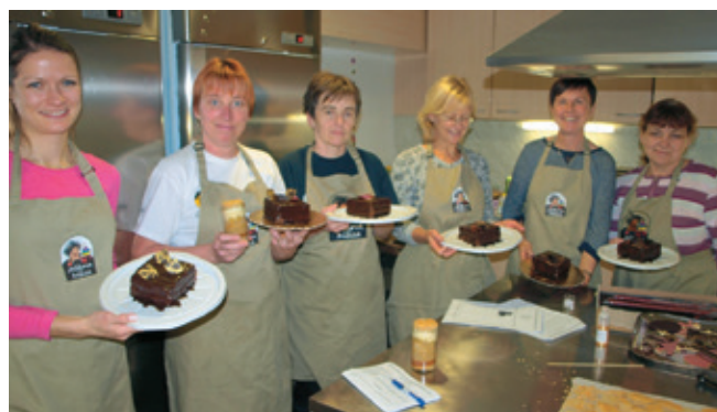
Tečajnice s svojimi tartufattami

Tudi sosedom je tako letos dišalo po čokoladni tartufatti s hrustljivimi praženimi lešniki ter božični sladici v lončku z ingverjem, cimetom, jabolčno čežano, vanilijo in karamelom. Z novim letom pa načrtujemo nadaljevanje »sladke šole« pri Torteriji.