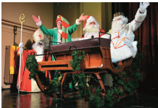
Trije dobrotniki in škrat med njimi