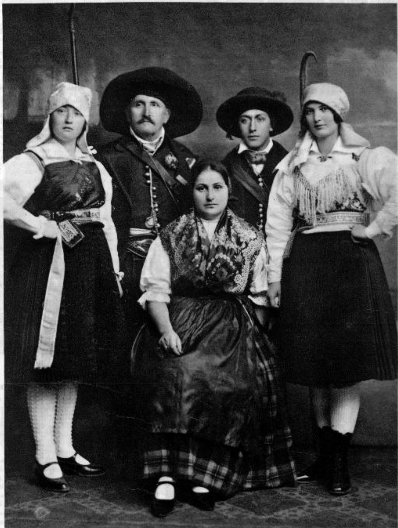
Naše slovenske narodne noše: Skupina Korošcev in Korošic

Leto V Jedenska priloga »Slovenca« (št. 59) z dne 10. III. 1929 Štev. 10