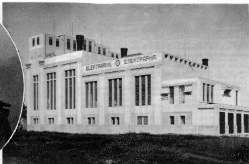
Nova moderna elektrarna

župan v Brabrovniku pri Ormožu, ki je nedavno obhajal 30 letnico svojega za- služnega in plodonosnega županovanja.