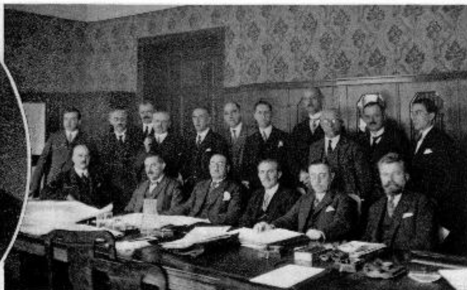
Udeleženci mednarodne železniške konference v Ljubljani