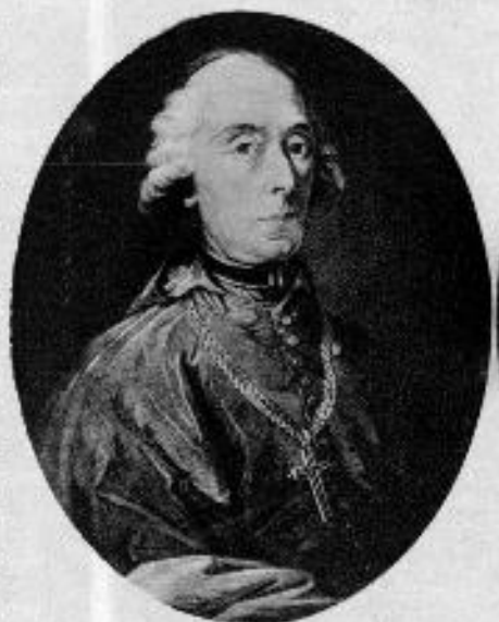
Hohenwart Sigismund (1745—1825) škof in botanik.