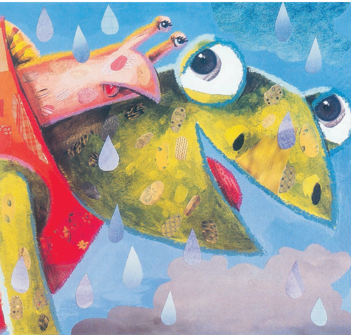
Ilustracija Mojce Osojnik ( Polž Vladimir gre na štop , 2003)