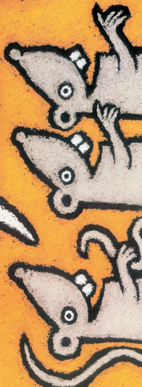
Ilustracija Lile Prap (Mednarodni živalski slovar, 2004)