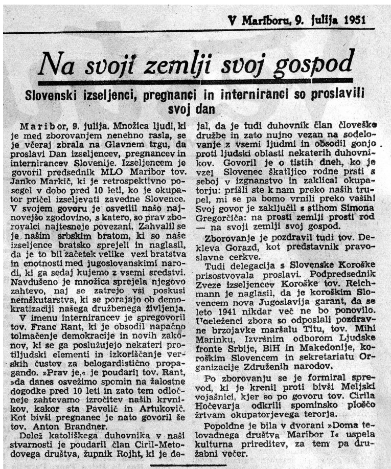
Slika 3: Vestnik, 9. 7. 1951: 2.

terorja. Potrebno je omeniti, da je odbor pripravil tudi prvo razstavo fotografij in dokumentov o izseljevanju slovenskega prebivalstva iz Štajerske in drugih delov Slovenije, ki so jih zasegle nemške oblasti. O tem dogodku je poročalo tudi takratno slovensko časopisje, tako predhodnik današnjega Večera (Slika 3), mariborski časopis Vestnik 6 in drugi tako Slovenski poročevalec (Slika 4) 7 , Tovariš 8 , 9 in Ptujski tednik. 10 (Slika 5)