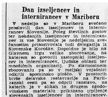
Slika 4: Slovenski poročevalec, 10. julij 1951: 1.

Kljub prvemu uspešnemu zborovanju slovenskih izseljencev v Mariboru se splošno politično in družbeno razpoloženje do izgnancev ni spremenilo.