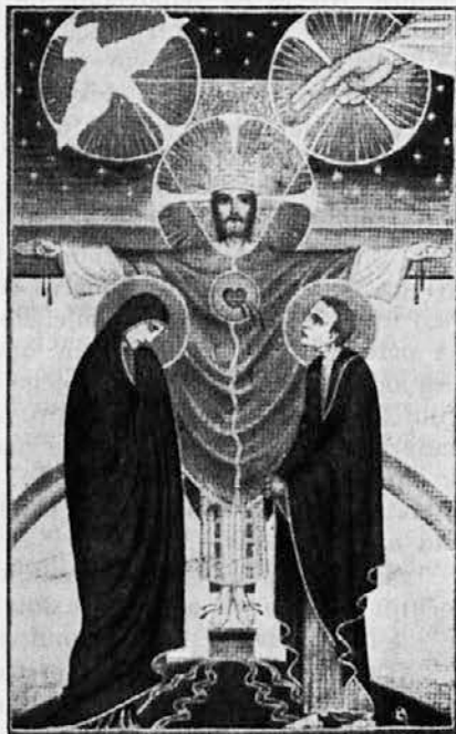
Slika iz Gottwaldovega misala

Zgane se nekaj v njem; »daj, pomagaj«. A čez trenutek ugasne: »Kaj bi z Njim, saj je moje delo dovolj, da ga prenašam.« Misli se ogniti. Toda ne more se. Čuti, da ga je Oni pogledal; če bi si zastrl oči, bi čutil s srcem pogled, ki prosi pomoči. In spet: »Zakaj si zaslužil kazen! Zdaj nosi.« Vojaki, ki so z Njim, se obrnejo k Simonu. Približa se in podpre križ. Čuti, da je težak. Smili se mu obsojeni, vendar misli: »Zato pač nič ne dobim.« Kljub temu v svoji možatosti neče očitkov, če ne bi pomagal. — »Nemara je pa res Obljubljeni.«