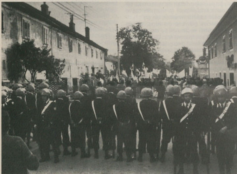
Po napeti tišini, ki je vladala pred klavnim zborovanjem mladih misovskih prenapetežev, se je bazovski trg sproščeno razživel.

Ne razpršimo svojih glasov za stranke, ki nimajo nobene možnosti stvarne uveljavitve. Ne razpršimo svojih glasov. Podprimo KPI, ki edina dosledno vodi boj za enakopravnost Slovencev in Italijanov v naših krajih, za pravice delovnih ljudi, za mir in sožitje med narodi v Evropi. Učvrstimo evropsko levico!