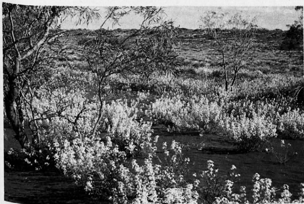
SIMPSON DESERT. Ko pa okrog vsakih 10 let dežek napoji to rdečo zemljo "Mrtvega srca" naše Centralne Avstralije, je v nekaj tednih vse v čudovitem cvetju ...