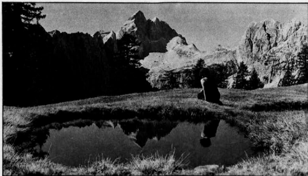
Motiv na Slemenu z Jalovcem (2643 m) v ozadju

Upam, da sem s člankom ustregel vsem, ki so mi izrazili svoje začudenje, da niso našli kaj več o papeževem obisku v prejšnji številki. Žal je nemogoče vsem in takoj ustreči. — Ur.