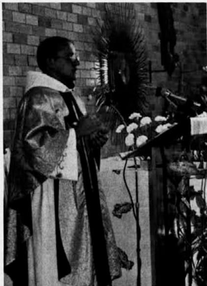
P. Tone med ponovitvijo nove maše pri Sv. Rafaelu v Sydneyu

BOŽJI GROB bomo imeli od petka popoldne po končanih obredih in vso soboto do začetka velikonočne vigilijske. Gotovo pridite in se zahvalite Jezusu za neprecenljivi dar odrešenja! – Pri našem cerkvenem vhodu bo objavljen seznam molivcev pred Najsvetejšim. Poskrbite, da bo med njimi tudi vaše ime!