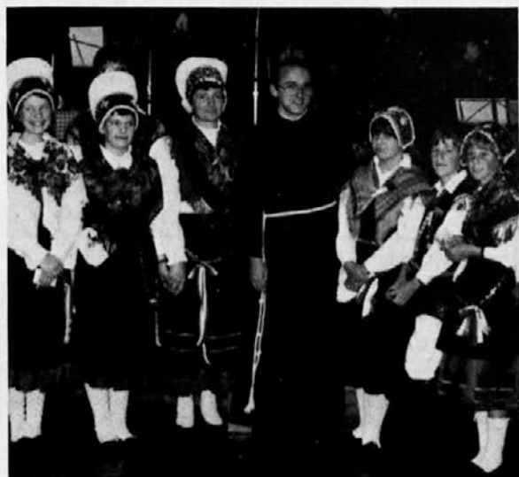
P. Tone po ponovitvi nove maše v Kew, na dan prihoda v Avstralijo 8. decembra 1986

O Bog, nočeš smrti grešnika, temveč želiš, da se spreobrne. Usliši naše prošnje: blagoslovi + ta pepel, ki si ga bomo posuli na glavo, saj vemo, da smo iz prahu in da se v prah vračamo. – Štirideset dni si bomo prizadevali, da bi nam ti odpustil grehe in nam podaril novo življenje svojega od mrtvih vstalega Sina, ki s teboj živi in kraljuje vekomaj.