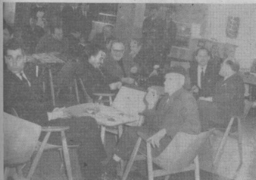
»Kdo bo srečni dobitnik?« so ugibali udeleženci žrebanja.

Nekaterim srečnim obiskovalcem našega javnega žrebanja v delavskem klubu pa je žreb dodelil 13 dobitkov, ki so jih prispevali: turistično društvo Velenje, hotel »Paka«, TP »Velma« in »Bazen«, Mladinska knjiga, delavski klub, TGO »Gorenje« in RL Velenje.