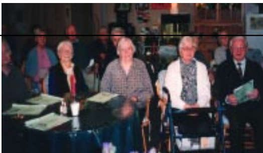
DOM POČITKA MATERE ROMANE Slovenski dom za ostarele 11-15 A'Beckett Street KEW VIC 3101