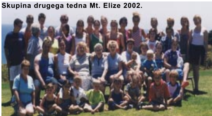
Skupina drugega tedna Mt. Elize 2002.