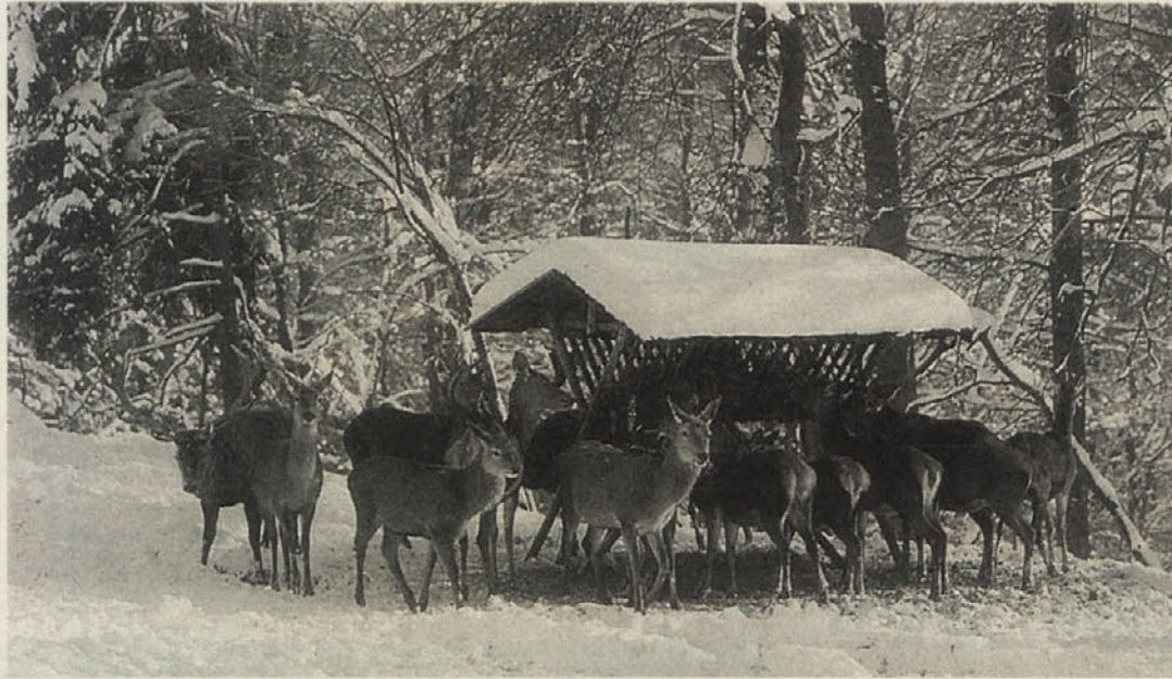
Predstavljali smo si, da nas bodo tako idilično pričakali jeleni, ...