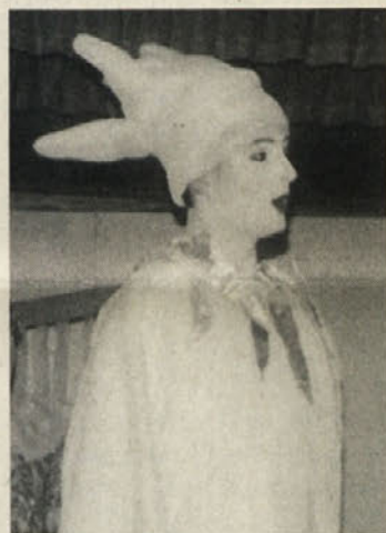
Simpatični Vilinček z lune

ob zlatih hruškah na županjinem vrtu zaplete. Za krajo obdolžijo prav njega, izkaže pa se, da je tatica prebrisana zemljanka. No, navsezadnje pa jo vendarle odkrijejo, in konec dober, vse dobro in pa da v pravljičah zmaga pravica, sta osnovni izpovedi predstave.