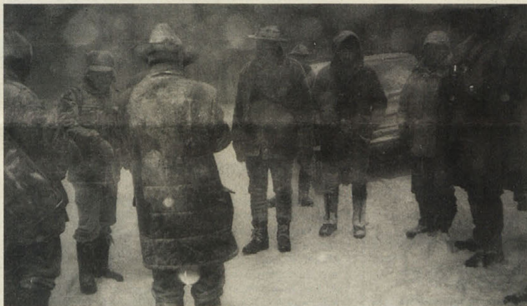
... v resnici pa nas je zajel strupeno mrzel snežni vihar

jatelj lova, že leta 1950 odhajali s svojim lovskim orožjem na organizirane skupne love na Kočevsko, je današnje ravnanje avstrijskih oblasti popolnoma nerazumljivo. Nesprejemljiva in trdovratna avstrijska prepoved prenosa osebnega lovskega orožja preko državne meje v Slovenijo je izraz prave »svinčene oz. ledene dobe«. Nesmiselna je tudi zato, ker lovci iz drugih evropskih držav tam lovijo s svojim orožjem. Le kakšen nevaren potencial predstavlja avstrijski lovec, ki gre v Slovenijo na lov s svojo puško, katero po številki proizvodnje in številu nabojev prijavi na meji in jo po lovu tam spet odjavi in se vrne z njo domov? Da pa noben lovec ne posoja rad svojih lovskih »negovank«, naj bo le ob robu povedano.