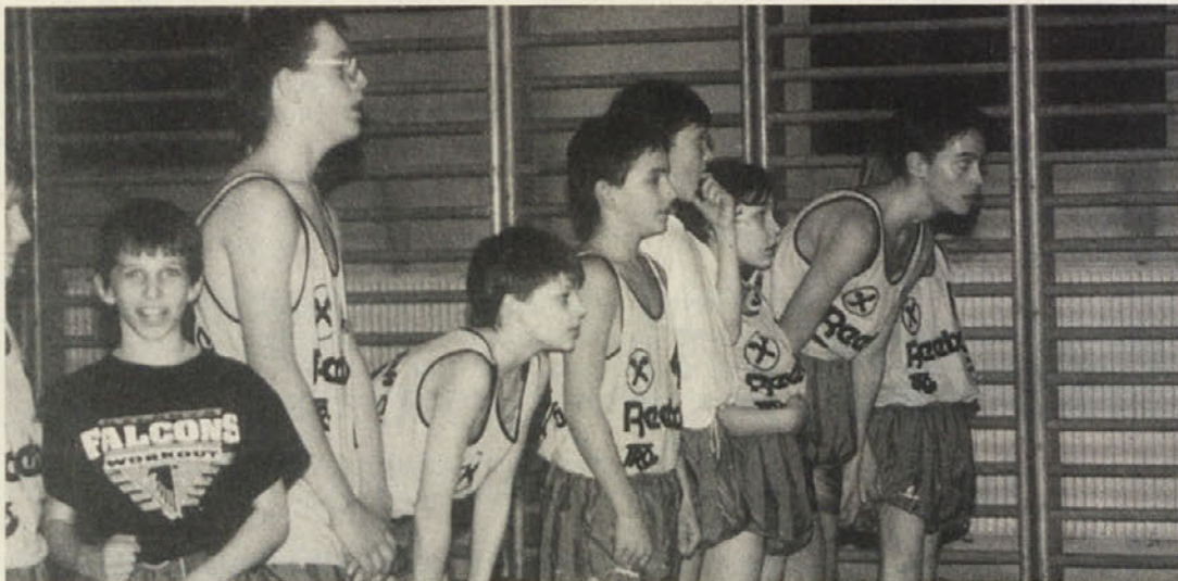
Najmlajši košarkarji SAK po prvi zmagi

V prejšnjem tednu so vse tri ekipe SAK doživele zmagoslavje na igrišču v Mladinskem domu.