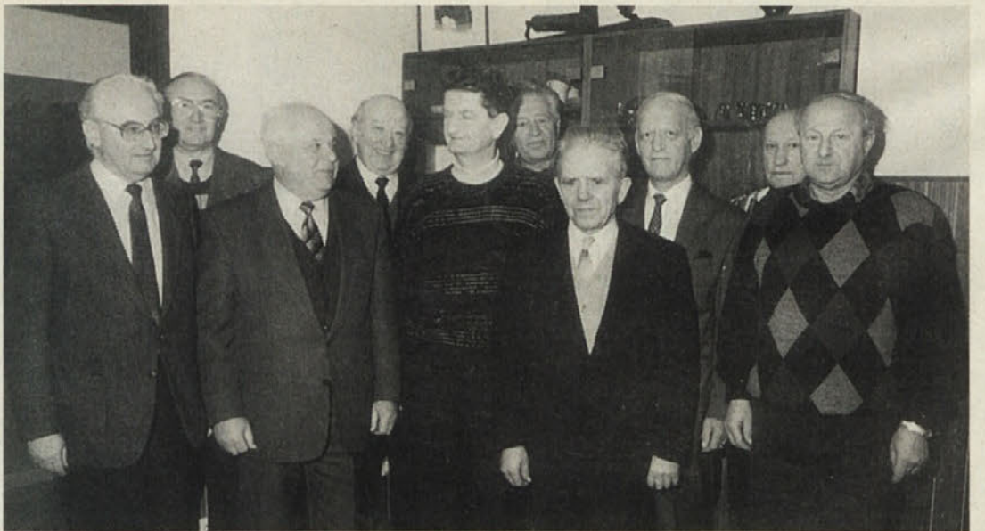
Člani sedanjega odbora Zveze slovenskih izseljencev ob svečani seji ob 50. obletnici ustanovitve organizacije

V nadaljevanju seje so odborniki še vsak iz svojih spominov in doživetij dopolnili podobo naše izseljenske organizacije, ki je v minulih 50 letih morala prehoditi težko kot premagovanja najrazličnejših težav, vendar je dosegla tudi vidne uspehe v boju za pravice