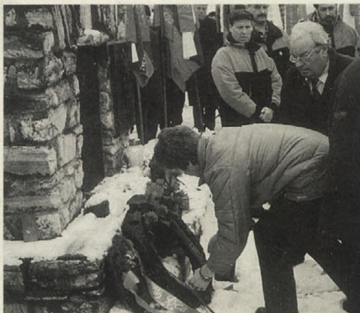
Predstavniki borčevskih organizacij so položili vence

Nedeljsko jutro, 4. februarja, je bilo zasneženo in padalo je še naprej. Prav nič prijazno vreme za prireditev na prostem, še bolj neprijazne ceste – drseče in nevarne. Le kdo se v takem vremenu poda na pot? Pa vendar! V Svečah poleg glavne ceste je pred enajsto uro stalo že kar nekaj avtobusov, pred gostilno v vasi pa se je množica udeležencev razvrščala v kolono in potem za prapori krenila proti pokopališču.