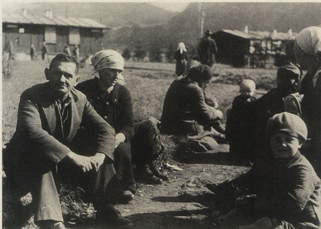
Od doma pregnani so v Žrelcu čakali na izselitev v taborišča