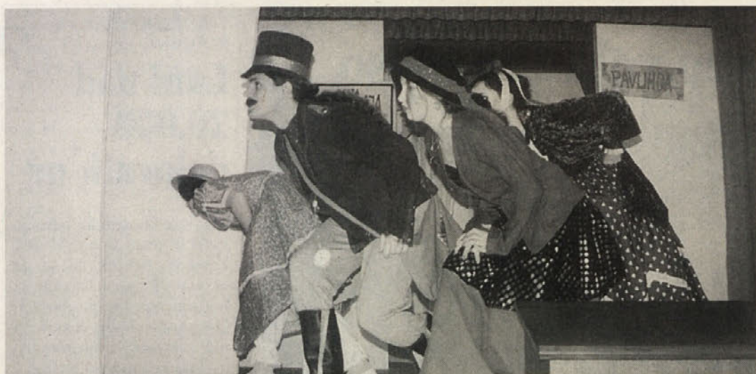
Le kdo je ukradel zlate hruške iz županjinega vrta?