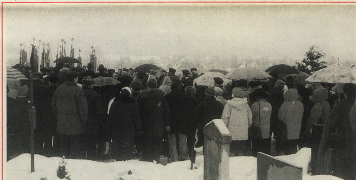
Spominske svečanosti v Svečah se je kljub sneženju in slabim potem v nedeljo udeležilo razveseljivo število protifašistov in demokratov z obeh strani meje.