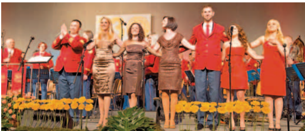
Slavnostni koncert Godbe Domžale z gosti v letnem gledališču na Studencu v petek, 6. junija, je pomenil vrhunec praznovanja 130-letnice najstarejšega domžalskega kulturnega društva, dan pozneje pa ga je zaokrožila povorka po domžalskih ulicah s prijateljskimi godbami, mažoretinimi skupinami in drugimi društvi.