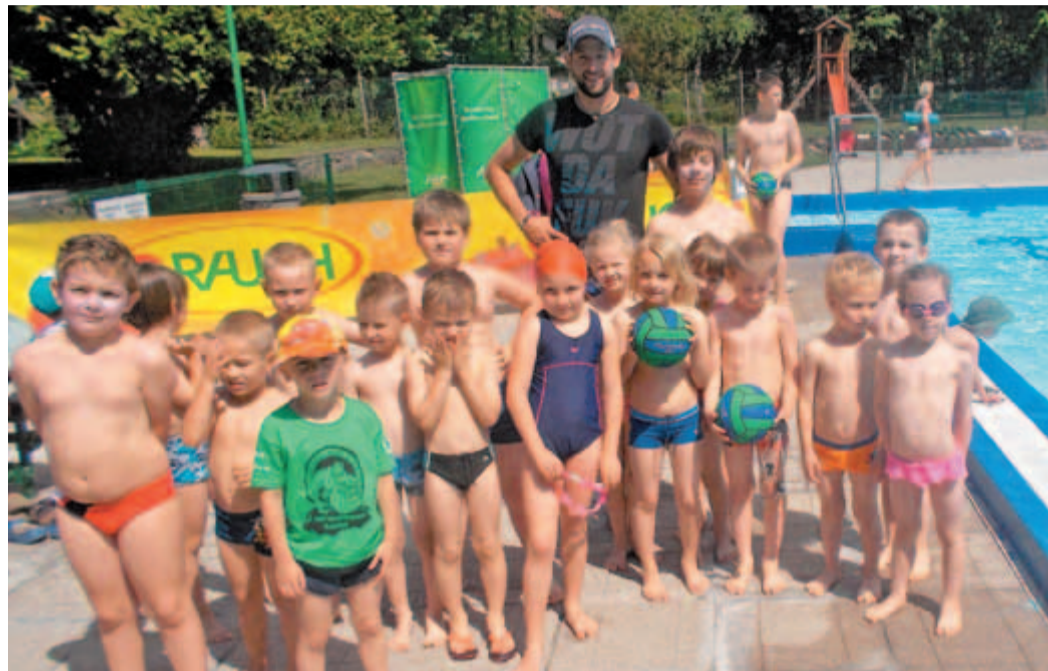
Najmlajši, ki so čez zimo vadili v pokritem bazenu zavoda Cirius Kamnik, so ob in v bazenu Pod skalo prvič spoznali veliki bazen.

Otvoritveni del dneva vaterpolistov smo izkoristili za podelitev nekaterih priznanj, za osvoje-