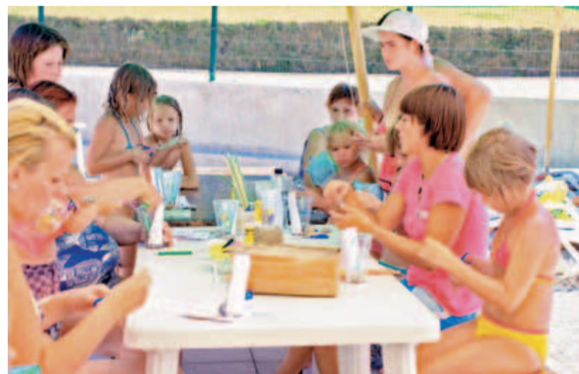
Tudi v Termah Snovik je živahen počitniški utrip, poleg vodnih vragolij vsak dan na bazenu potekajo otroške animacije in animacijski program za vso družino, ustvarjalne, plesne in druge delavnice.

Kakorkoli, pustimo otroku, da je poleti tako aktiven v različnih dejavnostih, ki ga zanimajo in zanje med šolskim letom nima časa, kot tudi, da malce lenari in mu je dolgčas. V Kamniku in okolici je za vse to dovolj možnosti. In to je tisti pravi čar dobrih, nepozabnih poletnih počitnic.