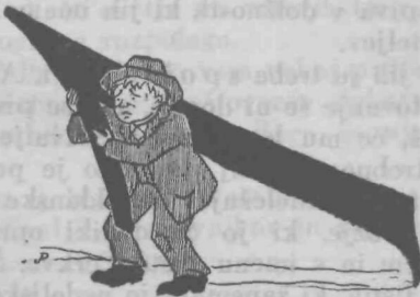
Nezadostno — —