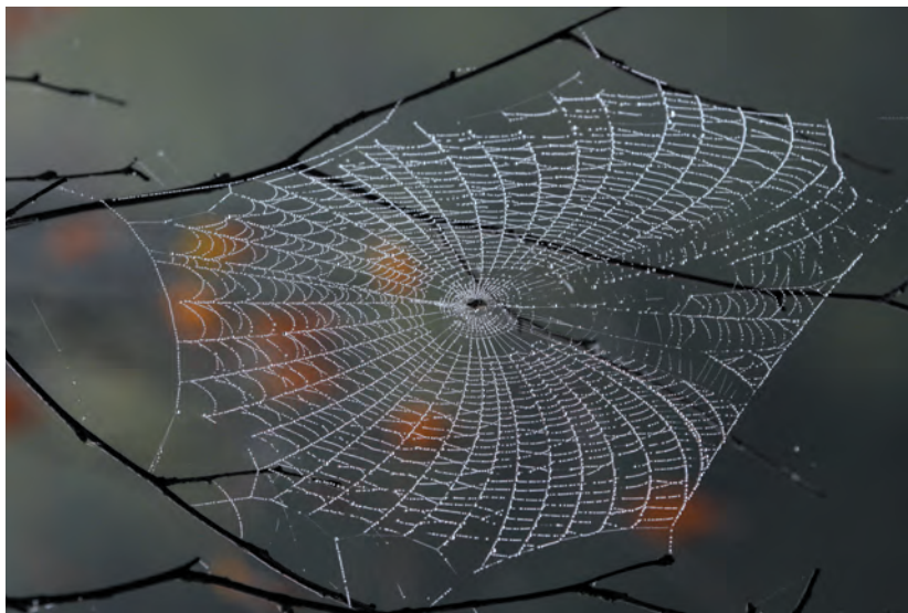
Pajkova mreža: Ujeto jutro.