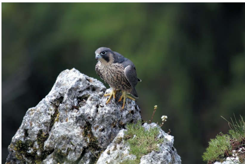
Sokol selec: Na preži.