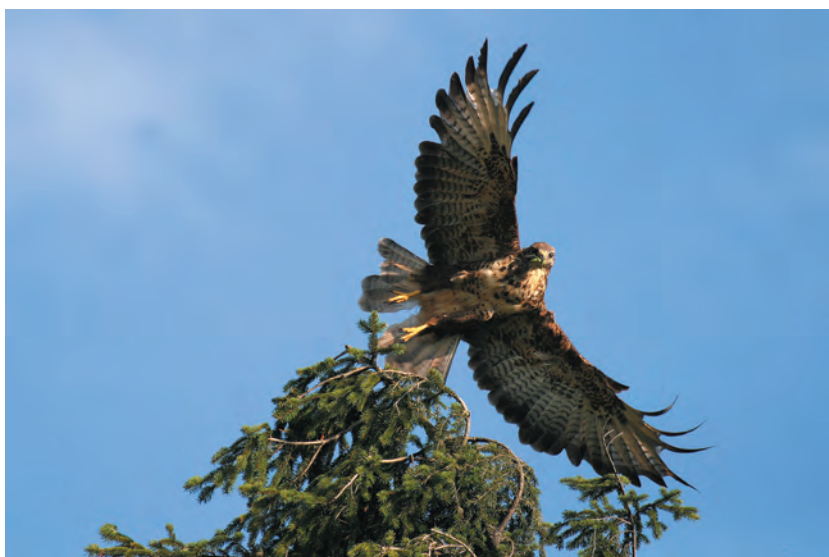
Kanja: Priprave na pristanek.