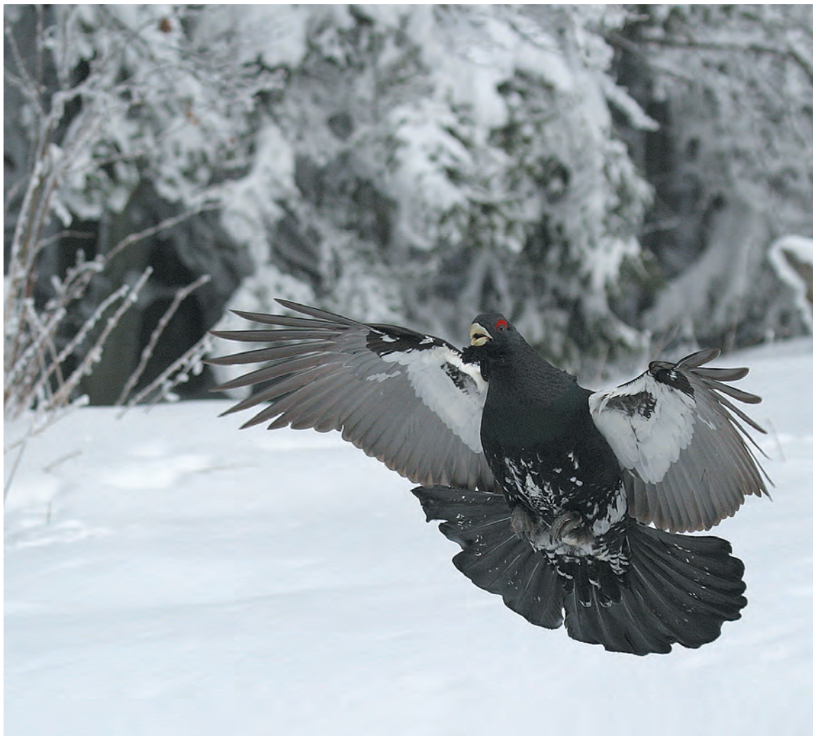
Veliki petelin: Prihod na rastišče.

Zanimivo, med Ivanovimi najljubšimi fotografijami so še posnetki, ki so nastali na diafilmih. V digitalni dobi pač ni tako zelo težko povečati občutljivost na 800 ali 3200 ASA, če je potrebno, tudi v svetlobno šibkejših razmerah. A pred leti, ko je obstajal le diazapis, je Ivan svetlobne težave pri fotografiranju petelina rešil tako, da je enostavno čakal dlje. Kot pravi sam, lovci so ga slišali peti na rastišču večinoma zgodaj zjutraj, zatem pa so odšli v dolino, ko se je sonce začelo dvigovati. Ivan pa je vztrajal,