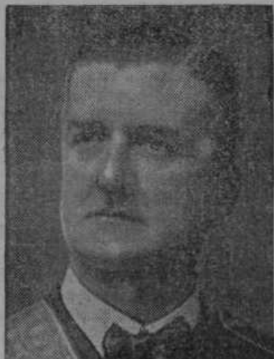
Regent Madjarske Horthy se bo sestal s Hitlerjem v Varšavi.