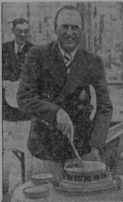
Norveški prestolonaslednik Olav je obhajal na ladji svoj 34. rojstni dan. Na sliki vidimo princa, ko reže za rojstni dan pripravljeni kolač.