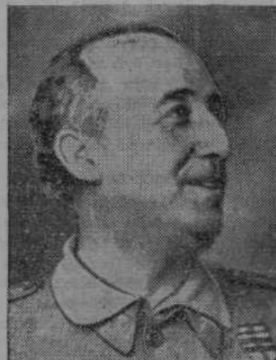
Najnovejša slika generala Franca, voditelja španskih nacionalistov.