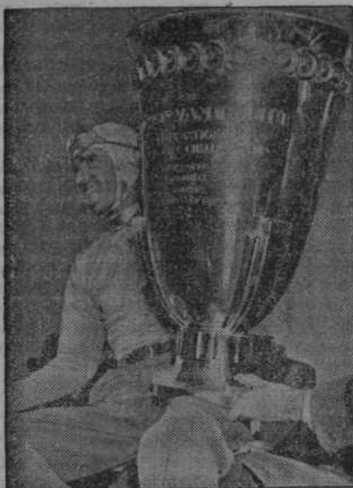
V bližini Njujorka se je vršila zadnje dni avtomobilska dirka za velikanski pokal, katerega vidimo na sliki.