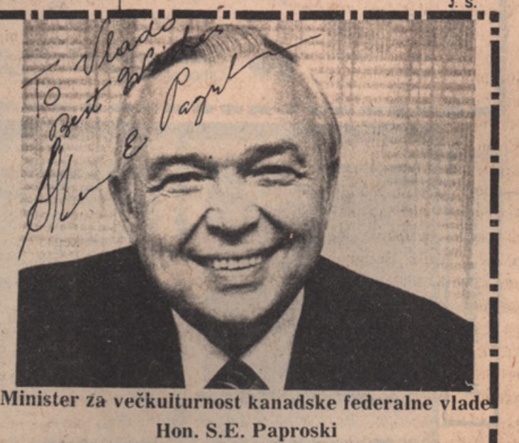
Minister za večkulturnost kanadske federalne vlade Hon. S.E. Paproski

• Monakovski kardinal Ratzinger je v pogovoru z mladimi izjavil, da znani teolog Hans Küng ne predstavlja več vere katoliške Cerkve.