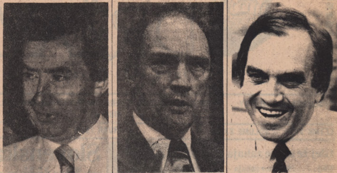
Who will take responsibility for the nation; where are the leaders with courage and vision for Canada?