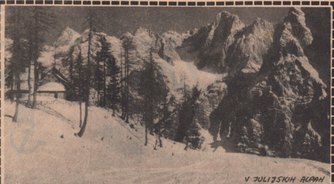
V JULIJSKIH ALPACH

PUBLISHED MONTHLY BY: SLOVENIAN NATIONAL FEDERATION OF CANADA, 646 EUCLID AVE., TORONTO, ONT., CANADA M6G 2T5