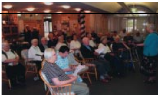
DOM POČITKA MATERE ROMANE Slovenski dom za ostarele 11-15 A'Beckett Street KEW VIC 3101