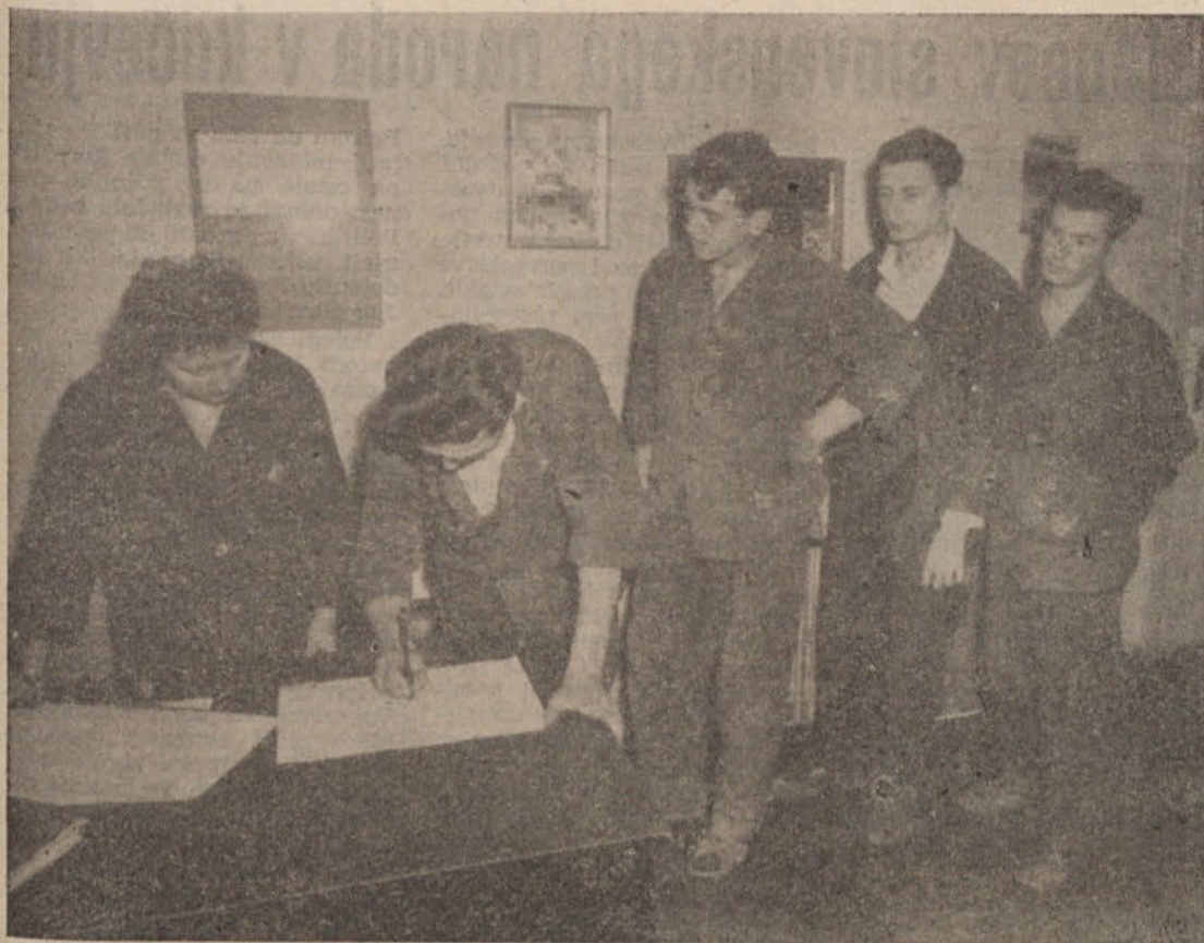
Prizor iz slehernega našega delovnega kolektiva: delavci in uslužbenci vpisujejo posojilo za obnovo in izgradnjo porušenega Skopja.

IZOLIRKA MED PRVIMI VPISNIKI LJUDSKEGA POSOJILA