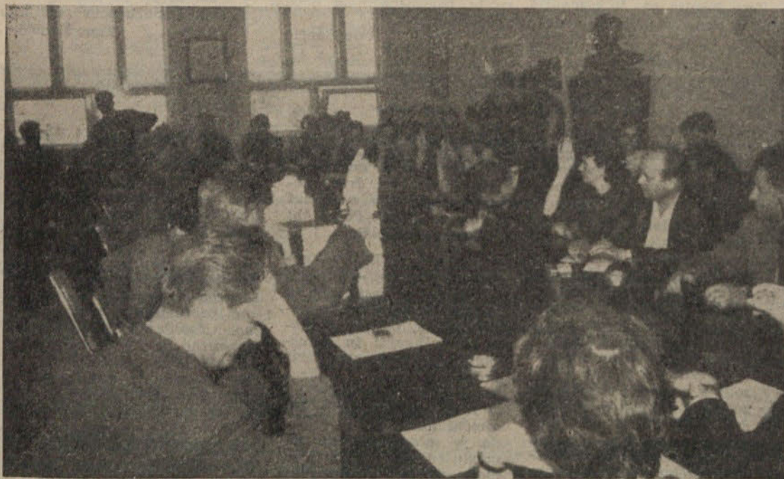
Sestanek DS v Saturnusu: enoglasen sklep o vpisu posojila tako delavcev in uslužbencev kot iz sklada delovne organizacije.