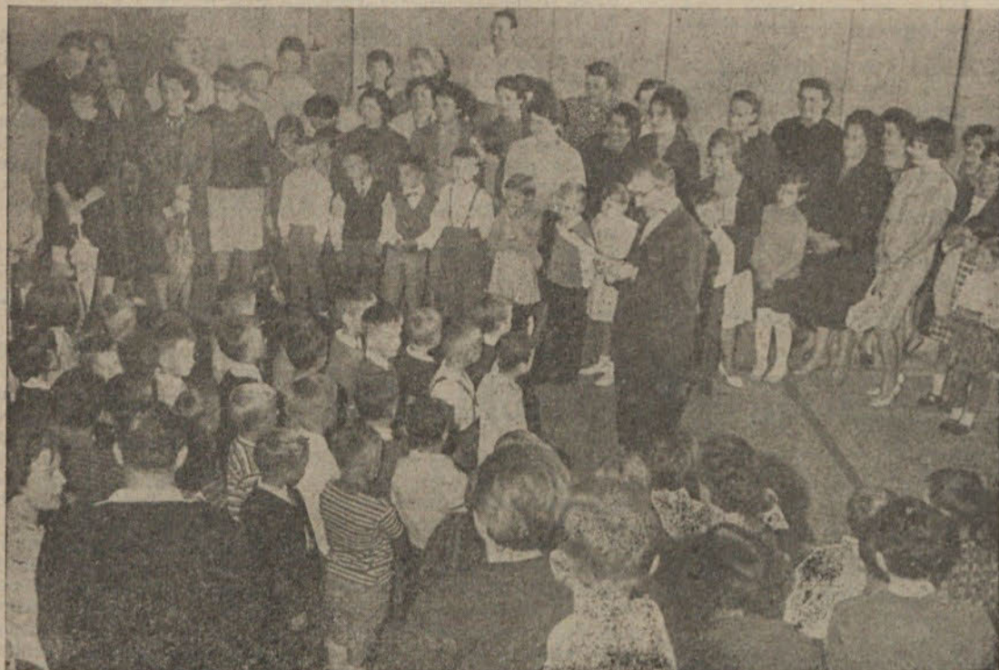
Prizor iz slovesnosti ob začetku novega šolskega leta v šoli Kette-Murna.

vsem učencem potrebna od prvega do zadnjega leta osnovne šole. Problem vzgojno-varstvene ustanove, ki je bila sočasno z osnovno šolo planirana kot nekaj del šole, je čedalje nevdružnejši. Starši s Kodeljevega nimajo kam z otroki; takih staršev in samemu sebi prepuščenih otrok pa je z vsako novo vselitvijo več. Da bi vendarle nekoliko omilili pritisk staršev, ki nenehno sprašujejo in si žele take varstvene ustanove, preurejajo na pobudo društva prijateljev