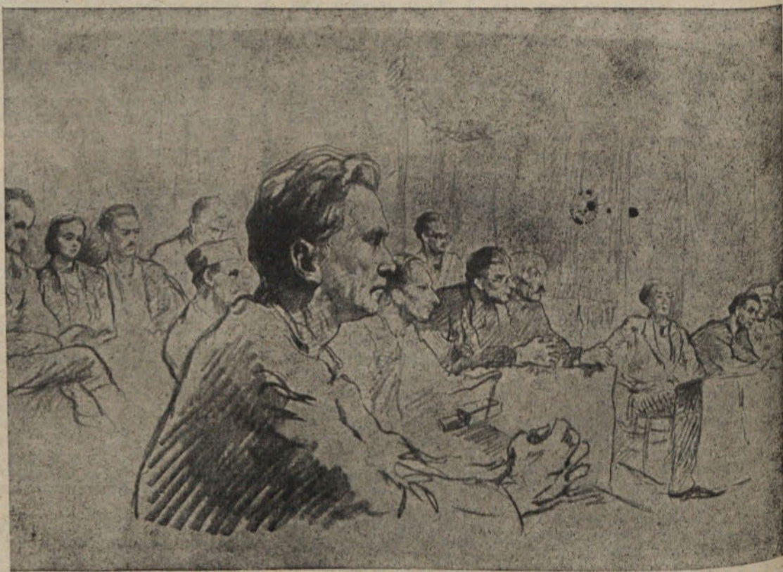
Iz skicirke Božidarja Jakca, udeleženca Kočevskega zbora odposlancev slovenskega naroda: zgoraj Boris Kidrič med govorom, spodaj Josip Vidmar in del odposlancev.