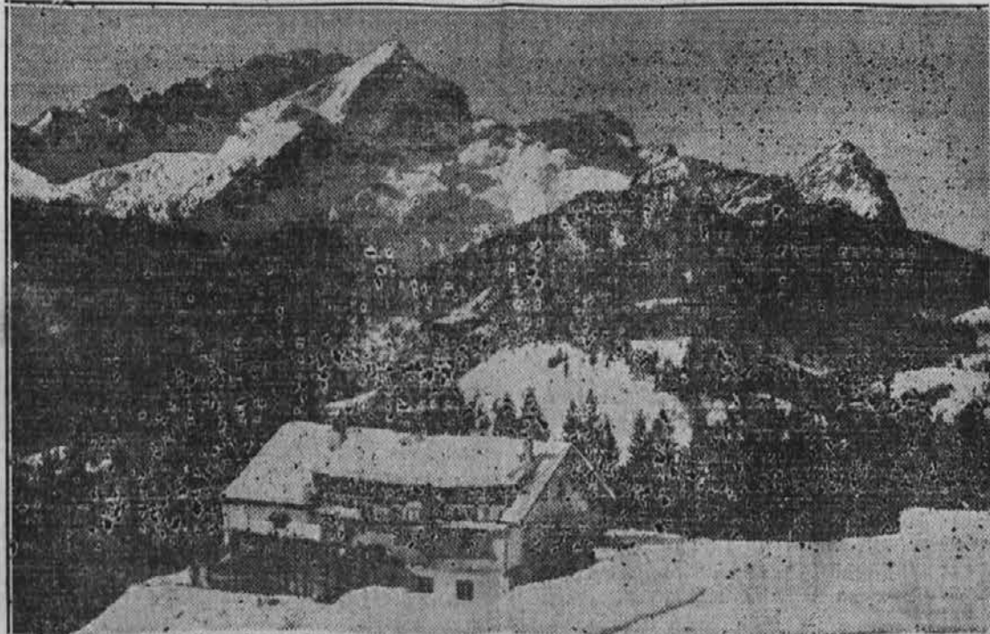
Gorska koča v bavarskih Alpah, znana pod imenom "Eckbauer Haus", ki bo nudila počitek mednarodnim smučarjem na njih poti k olimpijskim smučarskim tekmam, katere se bodo vršile meseca februarja in v katerih se bo ugotovilo, kateri narod je najboljši v smučanju.