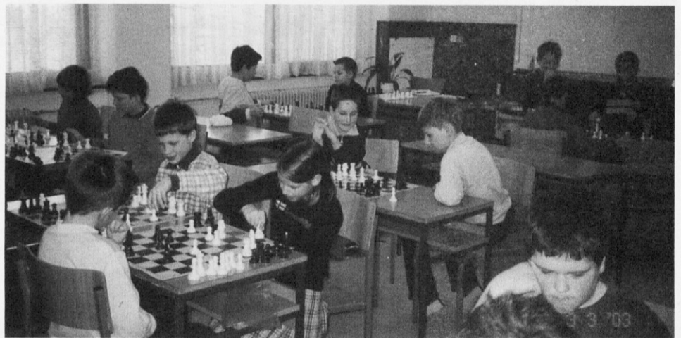
Raste nov rod zagrehtih šahistov.