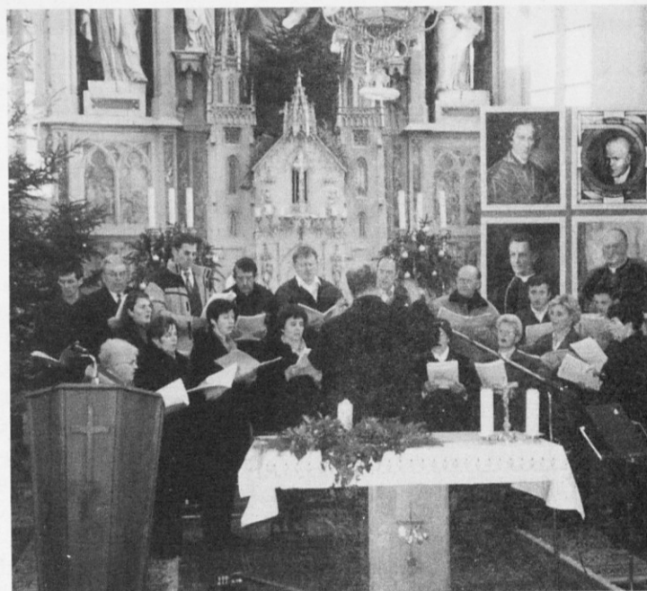
Mešani pevski zbor - z žlahtno tradicijo