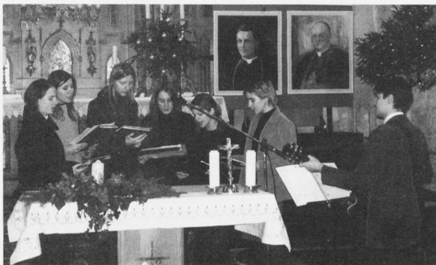
Cantamus vedno glasneje odmeva.