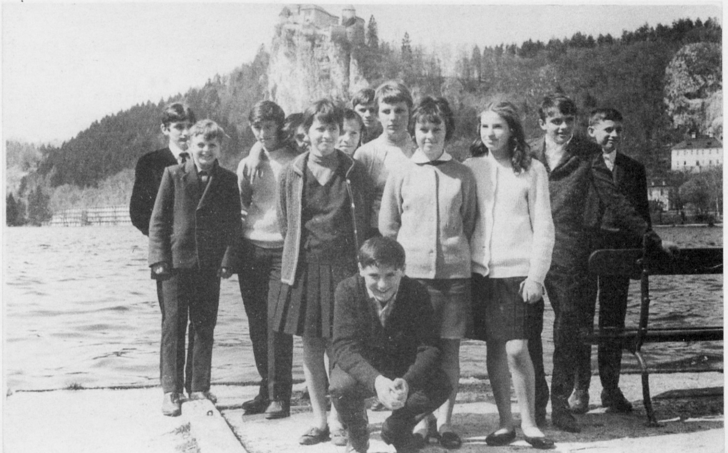
Ta fotografija pa je stara že 35 let, a je vredna objave, saj je to prepoznavna generacija, ki se je letos (ali se še bo) srečala z Abrahamom. Čestitke vsem!