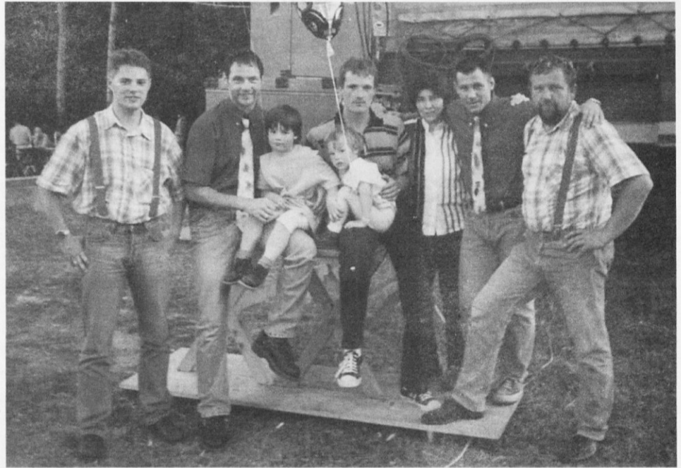
Večno mladi Čuki (četudi je nekoliko starejša slika)