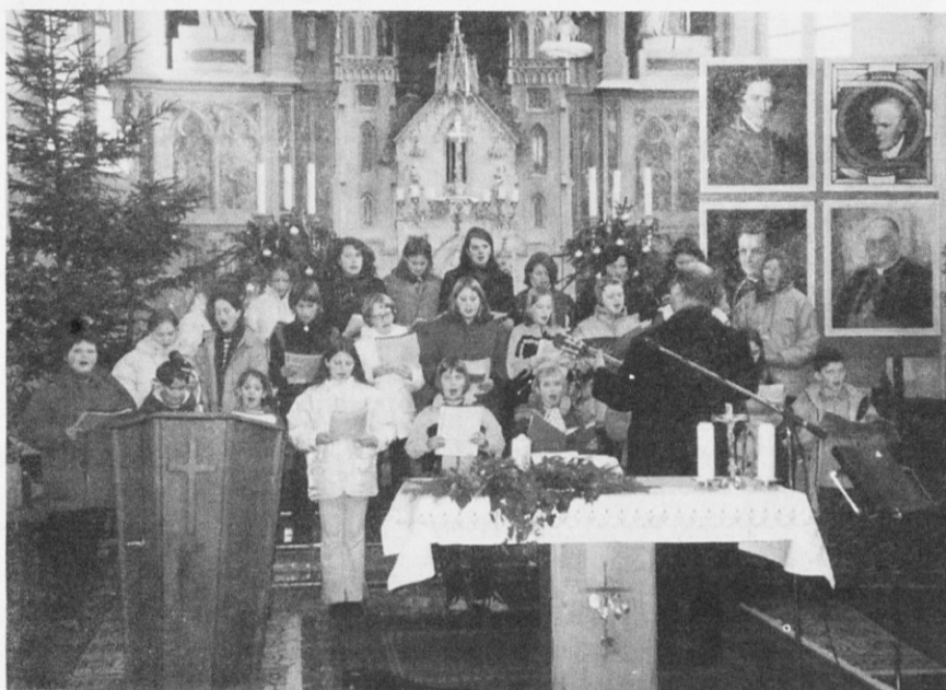
Glas iz mladih grl vedno pritegne.