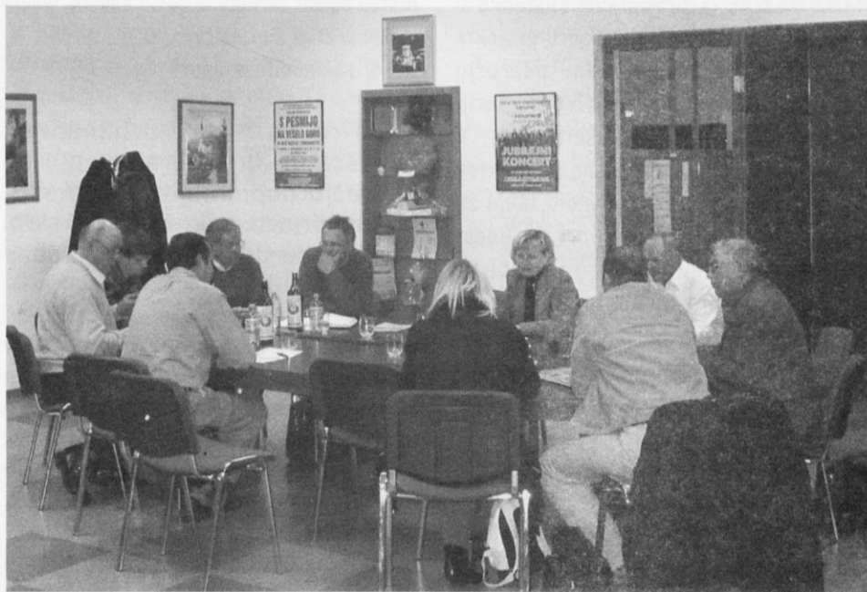
Z upanjem gledamo na prihodnost

Krajevne skupnosti imajo na področju razvoja mnogo potreb, želja in volje do dela, vendar se vedno znova srečujejo s problemom financiranja in sofinanciranja razvojnih projektov, kajti lastna sredstva so praviloma skromna. Razlog temu je prav gotovo tudi pomanjkanje informacij in pomanjkljivo poznavanje možnosti, načinov in postopkov, ki so potrebni za pripravo projektov do kandidature na raznih razpisih (tako domačih kot evropskih). Ker krajevne skupnosti praviloma ne razpolagajo s primernimi kadri, ki bi bili sposobni samostojno pripravljati vso potrebno dokumentacijo, se je nujno potrebno povezovati s strokovnjaki na širšem nivoju (občina, država). Tu pa se pojavlja kup vprašanj: Kam se obrniti? Koga vprašati? Kdo lahko pomaga? Koliko to stane? kateri razpisi so aktualni? Koliko je možnosti za uspeh? Kakšna so pravila igre?