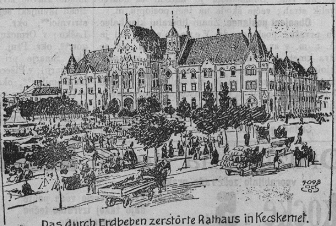
Das durch Erdbeben zerstörte Rathaus in Kečkemet.

Že v zadnji številki smo poročali o hudem potresu, ki je prizadel ogrske pokrajine. Zlasti hudo prizadeto je bilo mesto Kečkemet. To mesto je doživelo tudi lansko leto potres. Pri sedanjem ni ostala oboena hiša nepoškodovana. Dimniki so padli na ceste in v stanovanjih se je razbilo vso pohištvo. V mestu je zavladalo seveda velikansko razburjenje. Mestni rotovž, županišče in razne šole so bili porušene. Piatistovski cerkev so morali podreti. Telegrafi in telefoni so seveda tudi pretrgani. Škode je le v tem mestu za več milijonov kron. Vse cerkve in javna poslopja so morali zapreti. Dve osebi sta bili ubiti, mnogo pa jih je ranjenih. Naša silka kaže glavni vzrok mesta Kečkemet z rotovžem, ki je zdaj hudo poškodovan.