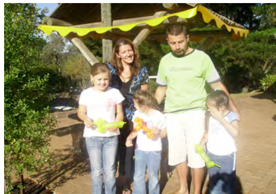
Posnetki iz Lovske Veselice. Kot starejši, tako tudi mlajši obrazi.