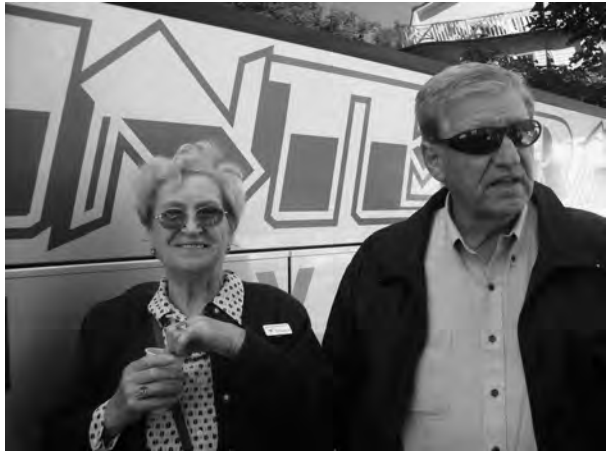
Še posnetki iz nastopa in potepanja po Evropi.