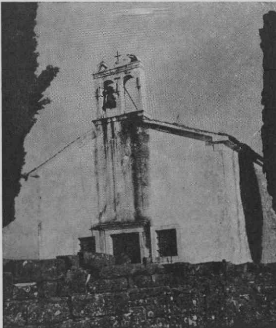
Cerkvica v Brčeni (sedaj Brič). Stavba je verjetno iz 14. stoletja. Popolnoma je bila prezidana proti koncu 17. stoletja. Pred cerkvijo je še zaznaven tržni prostor

Iz pritožb, ki smo jih omenili, lahko sklepamo, da se kmetje niso pritoževali proti sistemu, ki ga je Piran deloma prevzel od Ravnikarjev in omilil, deloma pa ustvaril v piranski dvorani Velikega sveta in podestatski pisarni. Kmetje so se pritoževali le proti samovolji kaštelanov, proti tako imenovanim »novostim«, ki jih je povzročala njegova birokracija, proti kršenju starih običajev, kar je pomenilo tudi kršenje vaške samouprave ali v