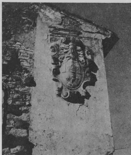
Grb momjanskih gospodov. Grb je datiran z letom 1538. Danes je vzdian na stransko fasado propadajoče hiše pri vходу v Momjan

Poleg dajatev, ki jih listina navaja kot kaštelanove pravice, so imeli kmetje vse grofije (zopet z izjemo Sorbarja) v njenih določenih še celo vrsto drugih obveznosti in dolžnosti. Tako so morali vsi kmetje opraviti sedem dni tlake na leto. Tlako so opravljali na grajskem zemljišču. Kaštelan pa je smel predpisati še potrebno število delovnih dni, ko je bilo treba popravljati grajska poslopja in oljne mline. Druga dolžnost, ki verjetno izhaja iz prvih let piranske okupacije, je bila splošna obveznost do straže, ki so jo morali oprav-