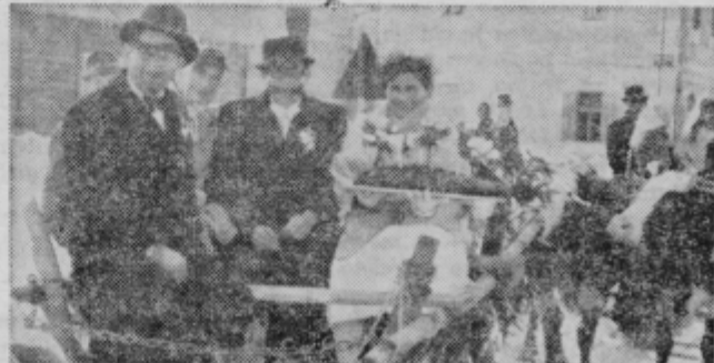
Karnevalska skupina z naslovom »Pleško gostujava« se je pripeljala na kmečkem vozu, ki so ga po stari karnevalski tradiciji vlekle krave