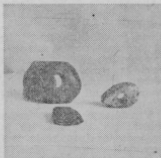
Kamniti sekiri iz mlajše kamene dobe ter utež za statve iz dobe Ilirov

ne mize pozdravi človeška lobanja z avstrijsko vojaško kapo. Marsikomu bi zatal korak. Toda ljubitelja to sa-