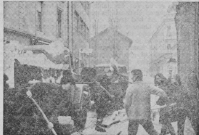
Mladi so brez obotavljanja prišli za lopate in na športni dan čistili zasnežene mestne ulice.

Da bi mesto kar hitreje izkopal iz snega, so prišli za lopate tudi dijaki ptujskih šol. Na športni dan so na ptujskih ulicah in na dravskem mostu urno vihteli lopate in vozovi so bili kmalu naloženi. ZR