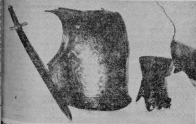
Prsni oklep, rokavica in bodalo iz srednjega veka

ino nekoliko kasneje, ko je začel zbirati razne starine. Po osnovni šoli je želel v gimnazijo, zaradi kasnejšega študija zgodovine. Toda matematika je bila ta, zaradi katere se je odločil za uk. Kljub te-