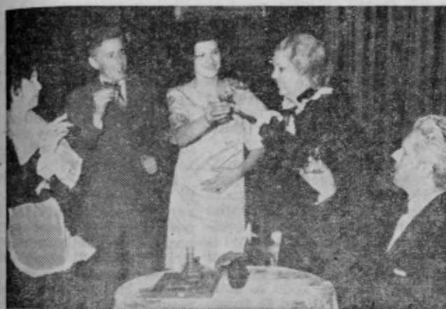
Posnetek z uprizoritve