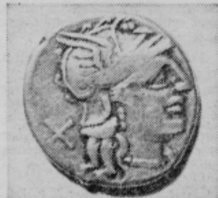
Novec iz rimskih časov

Najmočnejše pa je v njegovi zbirki zastopan srednji vek. Prsni oklep, rokavica, razna bodala in meči te spominjajo na srednjeveške vi-