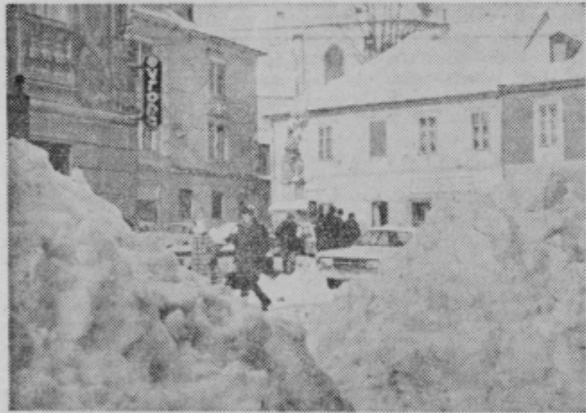
Med kupi snega na ptujskem trgu