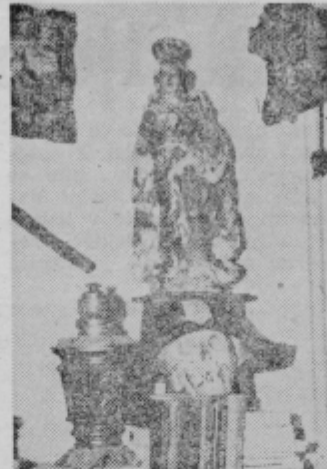
V Ferdovem »brlogu«

teze, na njihove boje in hrabrost. Posebno vrednost v njegovi zbirki predstavlja tudi staro strelno orožje. Ze-