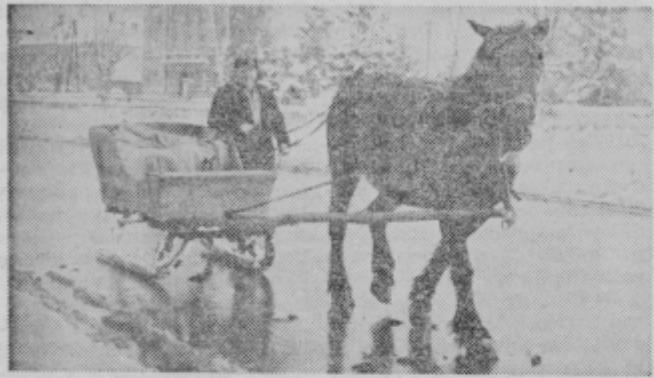
Na podeželju opravljajo promet v visokem snegu s sanmi. Nekaj smo jih videli tudi v Ptujju.

Stari pregovor »Zima ne tudi zastoje v prometu. Med- šenka« je tudi letos obve- tem ko so poročali iz vsega ljal. Po prvem snegu, ki je sveta še o večjih težavah, ki kmalu izginil, je bilo že ne- jih je povzročila zima, celo kaj za zimski čas še dokaj o smrtnih žrtvah, v ptujski prijetnih dni. Ni bilo snega občini kljub temu ni bilo in sonce je prijetno grelo. večjih katastrof. Kot po na- Zaman smo se veselili vadi, je tudi letos večji sneg kratke zime in že mislili na komunalnemu podjetju »za-