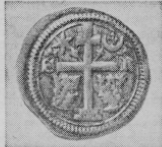
Novec Stjepana V. slovanškega, iz l. 1272

Ko potuje oko s predmeta na predmet, nehote pomisliš na razvoj človeka. Kako je začel s kamnito sekiro v mlajši kamni dobi, ki jo ima