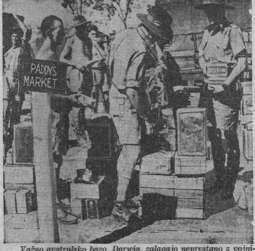
Važno avstralsko bazo, Darwin, zalagajo neprestano z vojnimi zalogami, tako da bodo lahko kos obrambi in napadu.