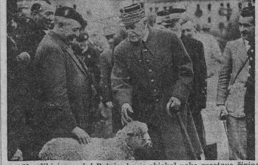
Na sliki je maršal Petain, ko je obiskal neko razstavo živine in drobnice, preden se je moral umakniti pred izdajalcem Lavalom. Maršal si ogleduje ovna, ki je dobil prvo nagrado.