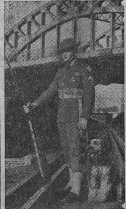
Prizor, kakršen je gornji, kmalu ne bo nič nenavadnega okoli munijskih tovarn, kjer bodo prideleni vojaškim stražnikom tudi psi.