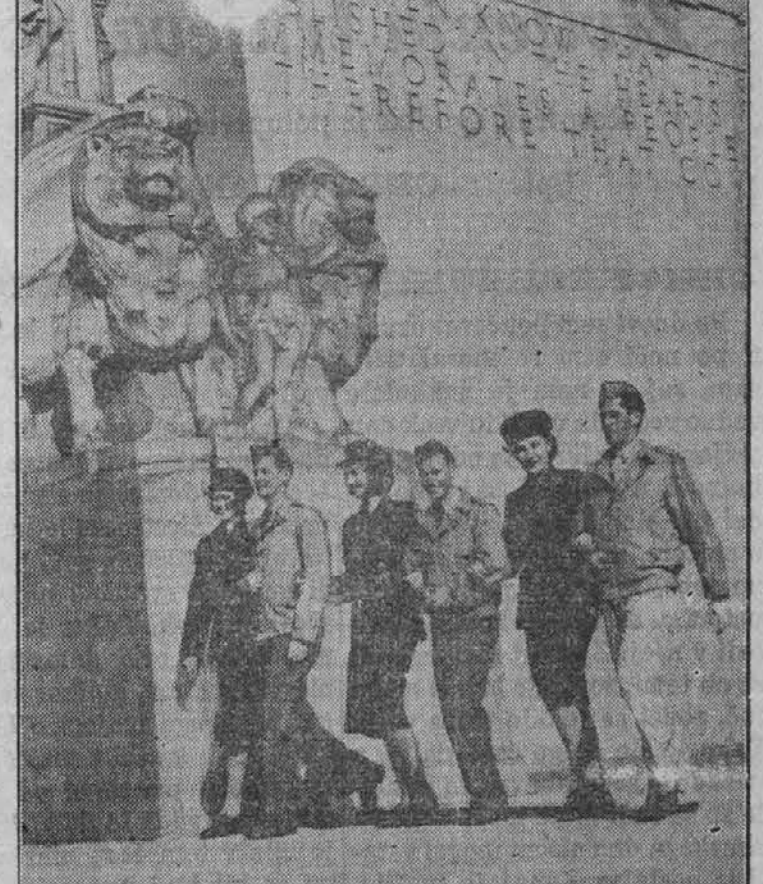
Na sliki vidimo troje ameriških vojakov, ki jim tri lepe Avstralke razkazujejo znamenitosti mesta Melbourneja.