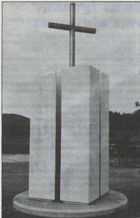
Spomenik žrtvam v Žužemberku