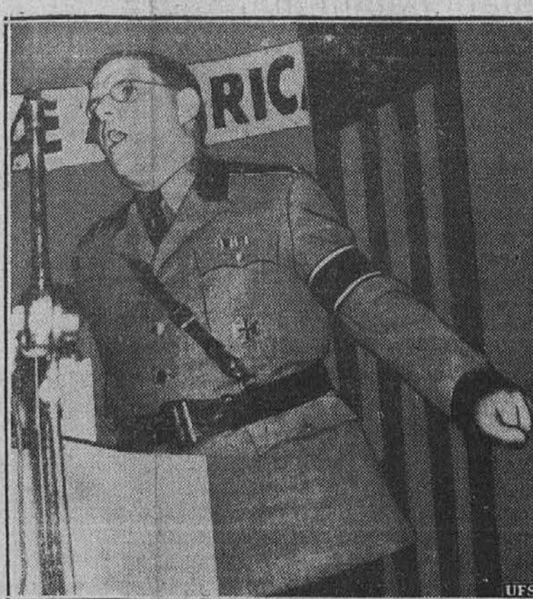
Na sliki vidimo Fritza Kuhna, voditelja ameriških nacistov, oblečenega v svoji nacistični uniformi, ko je te dni govoril na nacijskem shodu v New Yorku.