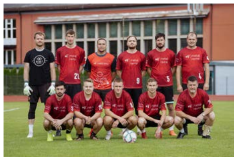
Srebrna ekipa Metal 1.

Nogometaši, čestitke za jekleno voljo in ferplej!