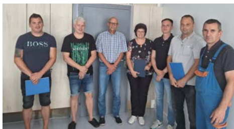
Na druženju smo podelili tudi priznanja naj sodelavcem s področja VZD v prvem polletju leta 2024.

kristina.lazarevic@sij.si katja.krumpak@sij.si