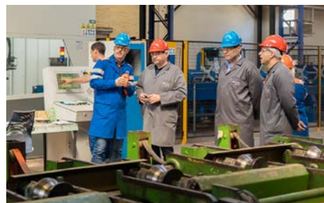
Predsednik uprave si je ogledal tudi novo luščilno-polirno linijo.