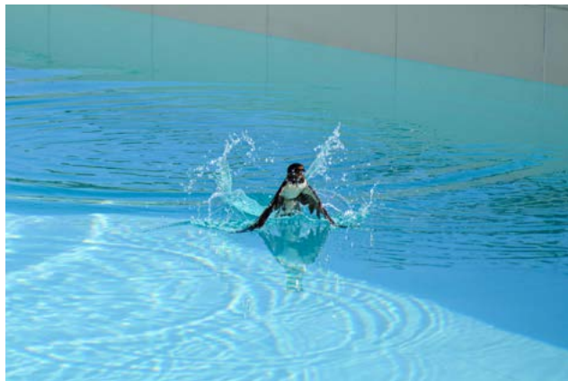
Finalna fotografija lanskega leta: Lastovka na Dugem otoku.