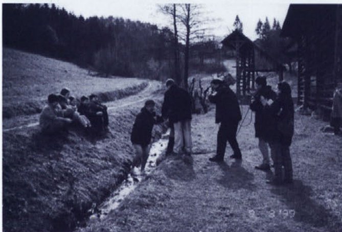
Mokronočan pač najhitreje postaneš, če krstiš podplate

Na začetku leta nas je razredničarka Olga Bartolj prijaviła za sodelovanje na oddaji TV Slovenija Pod klobukom. Ko smo vsi na to že malo pozabili, je prišlo obvestilo: "Pripravite se, prihajamo!"