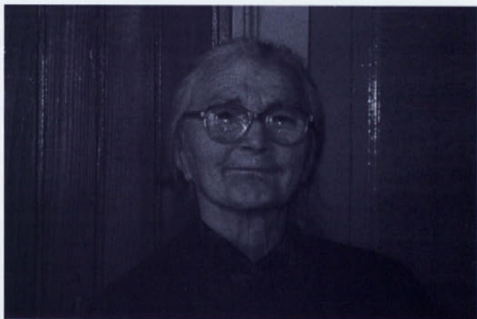
Dajte no mir s fotoaparatom! Pa še za časopis! se je branila ga. Obaha.