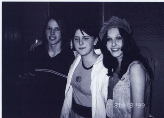
Kreatorki in manekenka. Se ne vidi? Pa bi gledali TV!