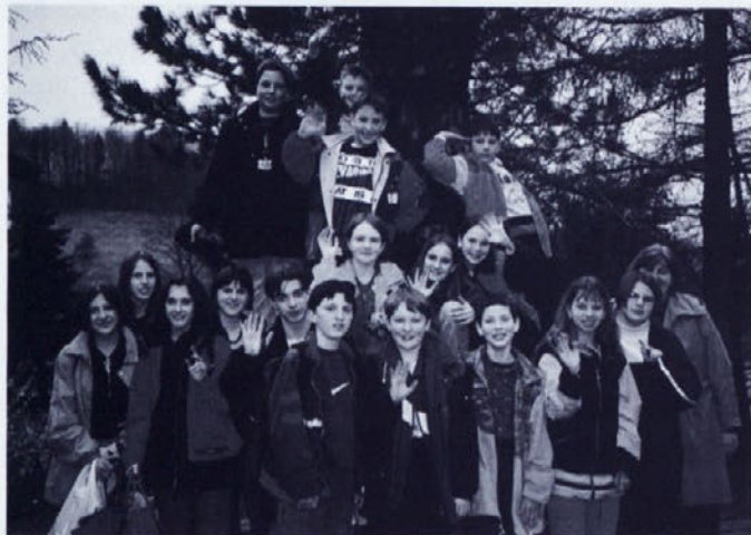
Pravzaprav, če dobro pogledate, je oblika klobuka še ostala.