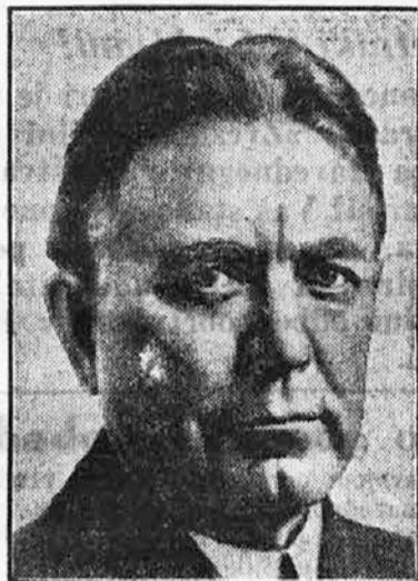
Ameriški senator Borah,

srdit pristaš revizije mirovnih pogodb, ki je s svojimi neprimernimi izjavami izzval znani incident ob času Lavalovega obiska v Washingtonu.