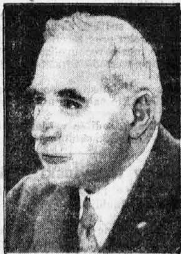
John Pierpont Morgan

V San Antoniu smo se izkrcali. Od tistih trideset tisoč nam je ostalo samo še štiri sto sedemnajst dolarjev, mi pa smo se še zmirom razgledavali okrog za preprostim življenjem na farmi. Naletel sem na nekega farmarja, svojega starega znanca, ki nas je povedel s seboj. Njegova farma je ležala kakšnih petnajst milj od mesta in se je razprostirala po gričih in dolinah, gozdovih in prerijah. Noben farmar si ne bi bil mogel želeti boljše zemlje. Mož nam je vse svoje posestvo s konji in z vso živino ponujal za petnajst tisoč dolarjev.