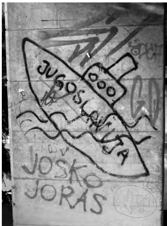
Grafit, Ljubljana, 2013

V enem med podhodi v središču Ljubljane je že petindvajset let na ogled grafit, na katerem je potapljaljoča ladja z imenom Jugoslavija. Čeprav so v tem času okoli njega nastali mnogi drugi novi grafiti in tagi, je v svojem bistvu ostal nedotaknjen. Razumem ga kot simptom ambivalentnega, celo polivalentnega odnosa Slovencev do svoje nedavne preteklosti, ki odpira vprašanja, kako se Slovenci danes, v svoji aktualni domovini, spominjajo svoje nekdanje, jugoslovanske domovine. 1