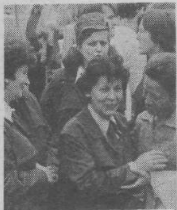
Tudi zunaj doma je vladalo veselje nad novo delovno zmago naših delavcev. Srečanja nekdanjih borcev in bork, aktivistov in aktivistik so to veselje še poglobljala

Dom je odprt. Pred programskim svetom s sosveti stoji odgovorna naloga, da bo upravičil zaupanje delavcev, ki so omogočili njegovo gradnjo, da bo prislulnil in usmerjal hotenja vseh, ki jim je namenjen. In namenjen je nam vsem, delovnim ljudem in občanom, ki želimo izkoristiti njegove prostore za organizirano delovanje v njem. AM