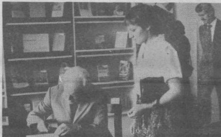
V prvem nadstropju je bila odprta priložnostna razstava umetniških in znanstvenih del naših občanov oziroma del, ki so nastala ali so vezana na našo občino. Z zanimanjem si jo je ogledal predsednik predsedstva SFRJ Sergej Kraigher in se avtorici razstave Za vašo in našo svobodo v spomin tudi podpisal (na sliki).