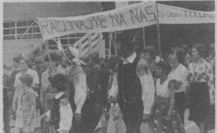
Občani iz vseh petih ljubljanskih občin so organizirano, slovesno, v narodnih nošah in z različnimi parolami prihajali na proslavo