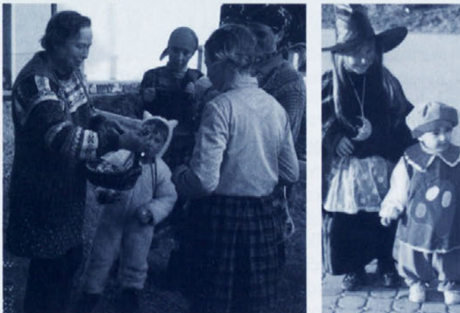
Malo upanja za oživitev Republike pa je še. Mokronajzarjev fotoaparati je ujel skupinico maškar, ki so razveselile babico v Šavrgasi.