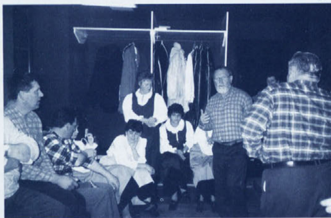
Zadnji dogovor pred nastopom.