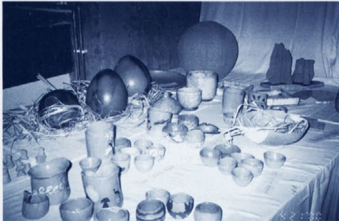
Del razstavljenе keramike