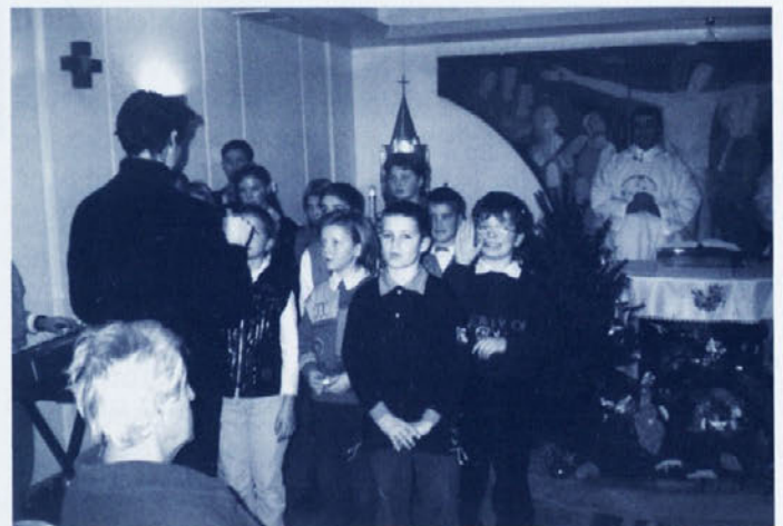
Nastop v kliničnem centru v Ljubljani.