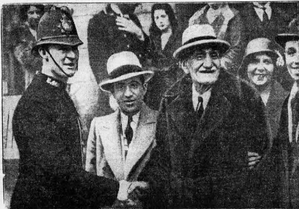
Najstarejši mož na svetu, Zaro Ago iz Carigrada, pride v Berlin. Zaro Ago je star baje 157 let. Rodil se je l. 1774. Zaro Ago se vrača iz Amerike.

stroj izpolniti tako, da daje do 13 odstotkov mehanične energije, vsa druga toplota pa gre še vedno v nič. Mnogo varnejše pa deluje človeško mišičje, ki črpa za svoje delo potrebno toploto iz vsakdanje hrane. Lačen človek seveda ne more mnogo »delati«, ker njegovo telo oziroma mišičje ni dovolj »zakurjeno«. Dokazali pa so točno, da porabi mišičje najmanj po 20 odstotkov toplote za »delo«, ostanek pa porabi, da se vzdržuje toplota telesa sploh. Še bolj varno izrablja toploto živalsko mišičje. Najboljši človeški tekač teče 9-6 metra na sekundo, konj pa 22 metrov na sekundo. To je dokaz, da dela živalsko mišičje še mnogo bolje kakor človeško.