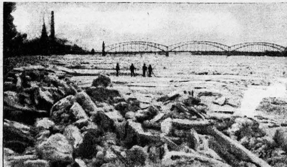
Pogled na zamrznjeno reko Memel pri mestu Tilzit-u. Ledene mase so povzročile povodenj, ki je napravila milijonsko škodo.