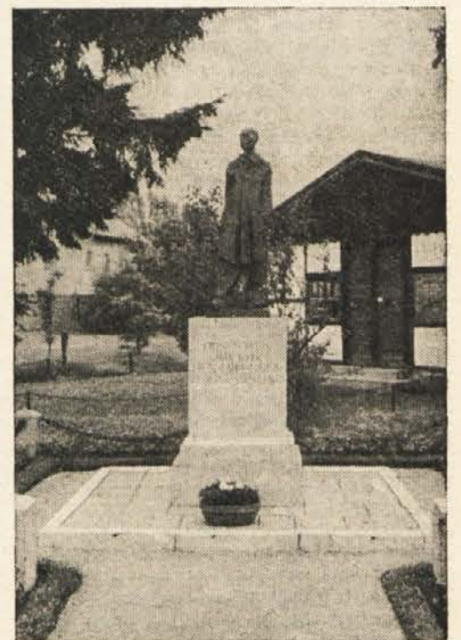
Spomeniki v nekdanjih taboriščih smrti spominjajo na čas, ko so nacisti uresničevali svoje zločinske načrte.

Die Endlösung der jüdischen Frage bedeutete die vollständige Ausrottung aller Juden in Europa. Ich hatte im Juni 1941 den Befehl erhalten, in Auschwitz Vernichtungsmöglichkeiten einzurichten. Zu jener Zeit gab es im Generalgouvernement schon drei