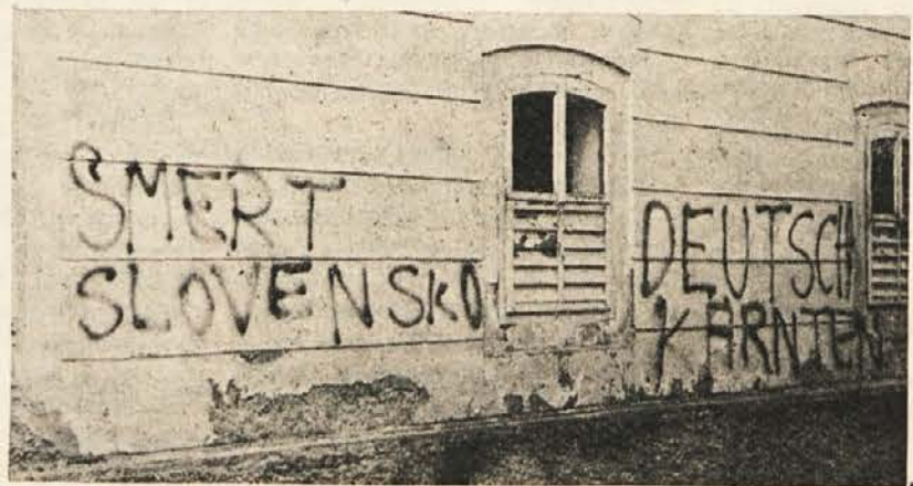
Nacionalistično hujskanje proti Slovincem ...

člani. Seveda je to število v prihodnjih letih še naraščalo in leta 1940 doseglo 40.000 članov. Visoko je bilo med koroškimi nacisti zlasti število žensk; v posameznih političnih okrajih jih je bilo tudi med 30 do 40 odstotki. Leta 1945 je imela stranka na Koroškem kakih 60.000 članov.