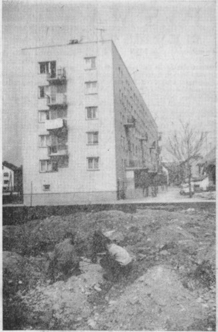
Posledica nemajhnih stanovanjskih okolšev in pomanjkanja igrišč v Celju — igra na smeteh in odpadkih.

Tudi ta kolovoz vodi v reber, kot vsi kolovози na tem svetu, tu, kjer Savinja v potoku liže korito. Na planjavi, streljaj od Savinje, je šola. Šola s štirimi imeni, lahko uporabiš tisto, ki ti prija, ob vsakem boš dodal delež otrok, ki se zjutraj vsujejo s pobočij okoliških hribov. Del te šole je pred nami, v izbi, ob mizi, na kateri je bil jabolčnik in savinjski želedec. Skozi okna je prihajal vonj po zemlji in šum Savinje. Tu in tam je zabrel avtomobil, ki je krotovičil cesto spodaj ob Savinji. Brnenje podobno brnenju avtobusa, ki zjutraj pelje fante in može s širokimi dlanimi. Nekam, tja, kjer so tovarne. Fante, ki so bili včeraj otroci, otroke, ki bodo jutri možje. Ta večer ni bil vklopljen televizor, ta luksuz samotne kulture, ki kraljuje negovan v kotu izbe, zakajene od zimskih večerov. Znova smo vnesli nemir v to svetlišče zapečka, nemir v oči dekleta, ki ni vedela, kam z nami in z rokami, ki jih je venomer predstavljala. Ni vedela, kam z našimi vprašanji, kajti kaj je v tem veli-