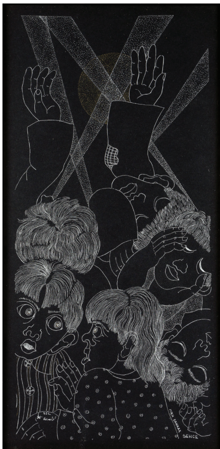
Sence (po motivu Ivana Cankarja), 2003, les, tuš na kartonu, 39 x 29 cm.

docela razblinijo ali pa ostajajo varno shranjeni nekje globoko v podzavesti. Avtor formalno in vsebinsko ostaja zelo blizu osrednjemu toku tiste sila redke, pristne in neomadeževane ljudske tvornosti, običajno dobro sprejete pri širši publiki, a redko dovolj cenjene in upoštevane v strokovnih krogih. Jovanovičeva izraznost je avtonomna, neodvisna od strogih stilskih omejitev, izobrazbenih zamejitev in sodobnih trendov. Gre za dela z lastno estetsko eksistenco in specifičnim duhovnim nabojem. Odlike njegovega risarskega ali kiparskega načina prepoznamo v zanimivih oblikovnih rešitvah, ki se ne ozirajo na stroga konvencionalna likovna pravila. Ne glede na ustvarjalni medij, naj bo to preprosta risba, knjižna ilustracija, relief ali monumentalna skulptura v javnem prostoru, prav vsako Jovanovičevo stvaritev prevevata individualnost in spontanost, ki sta temeljni lastnosti avtorje-