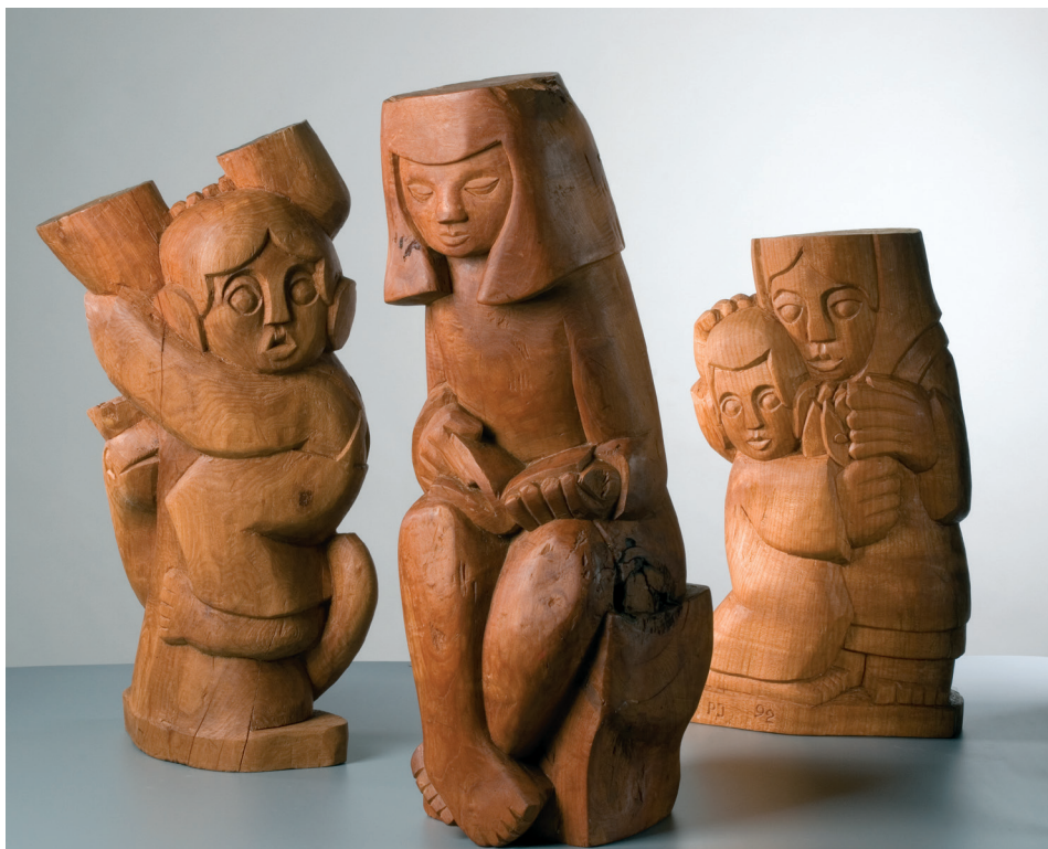
Od leve proti desni: Sedem let pri beli kači, 2007, les, 59 x 29 x 15 cm; Deklica s knjigo, 2007, les, 62 x 20 x 25 cm; Solzice, 2007, les, 48 x 30 x 16 cm.

in bližnja zgodovinska dogajanja. Motive najde tudi v klasični literaturi avtorjev, kot so France Prešeren, Tone Seliškar, Fran Levstik, Prežihov Voranc in drugi, domoljubno navdahnjeni pesniki.