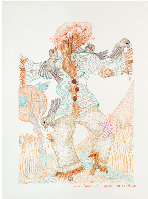
Vrabci in strašilo (ilustracija pesmi Otona Župančiča), 2006, tuš na kartonu, 39 x 29 cm.