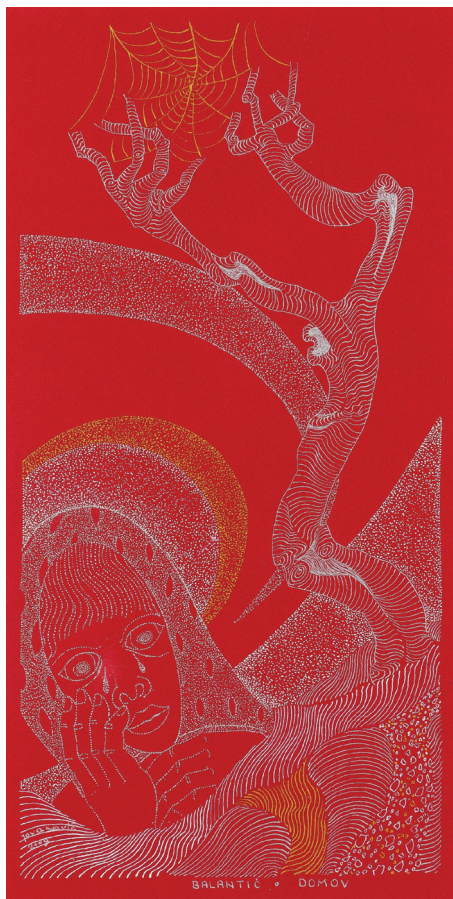
Domov (ilustracija pesmi Franceta Balantiča), 2009, tuš na kartonu, 39 x 29,5 cm.