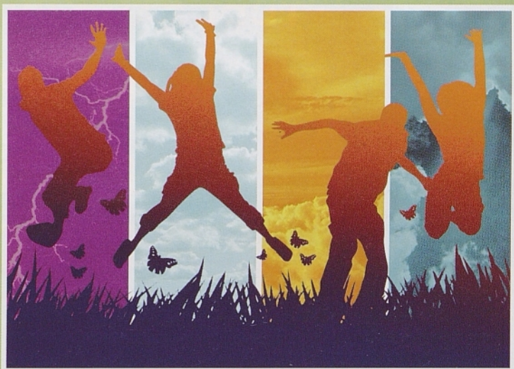
»Youth Power« (Matej Susič)

Večina jih torej rajši »pristane na ne ravno enostavne« naporne službe (z majhnim dobičkom), kot da je ne bi sploh imeli. Dodatno negotovost predstavlja zanje delo za določen čas, kajti nikoli ne vedo, čemu gredo naproti. Če jih