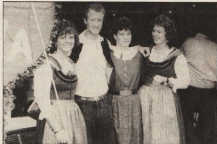
Slovenska mladina iz Podjune se je zabavala pretežno v šotoru SPD „Edinost“.

Gostinska in blagovna ponudba 597. pliberškega jormaka je bila zares rekordna, razstavljalci od daleč in blizu so zagotovili obiskovalcem ugoden nakup, v večernih urah pa je prevladovala zabava, saj takega ljudskega slavlja, kot je jormak, daleč naokoli ni.