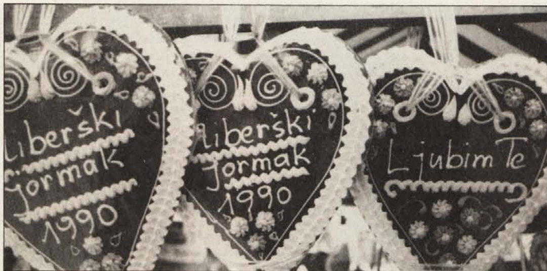
K odlični zabavi na „jormaku“ spadajo seveda tudi srca iz medenjaka in druge poslastice, čeprav so mnogi raje uživali pivo.

Prihodnja sejemska prirediteljev v Celovcu pa bo „Mednarodni lesni sejem“, ki se bo pričel 12. in bo trajal tja do 16. septembra.