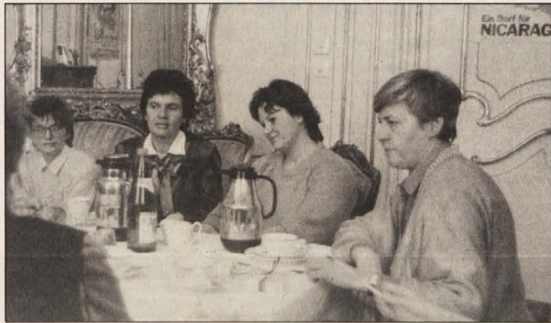
Dohnalova se je razgovarjala tudi z zastopnicami Zveze slovenskih žena

Tudi vodilna mesta v politiki, znanosti, gospodarstvu itd. so še vedno trdno v „moških rokah“. Ali se bo v prihodnjih letih pri tem kaj bistveno spremenilo?