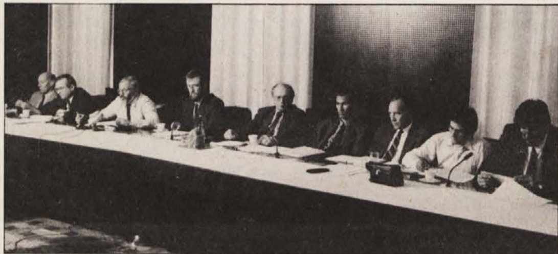
Pretekli teden je slovenska vlada podala rezime svojega doslejnjega dela. Ni bila nobena presenetljiva ugotovitev, da glavni problemi na Slovenskem še čakajo na svojo rešitev.