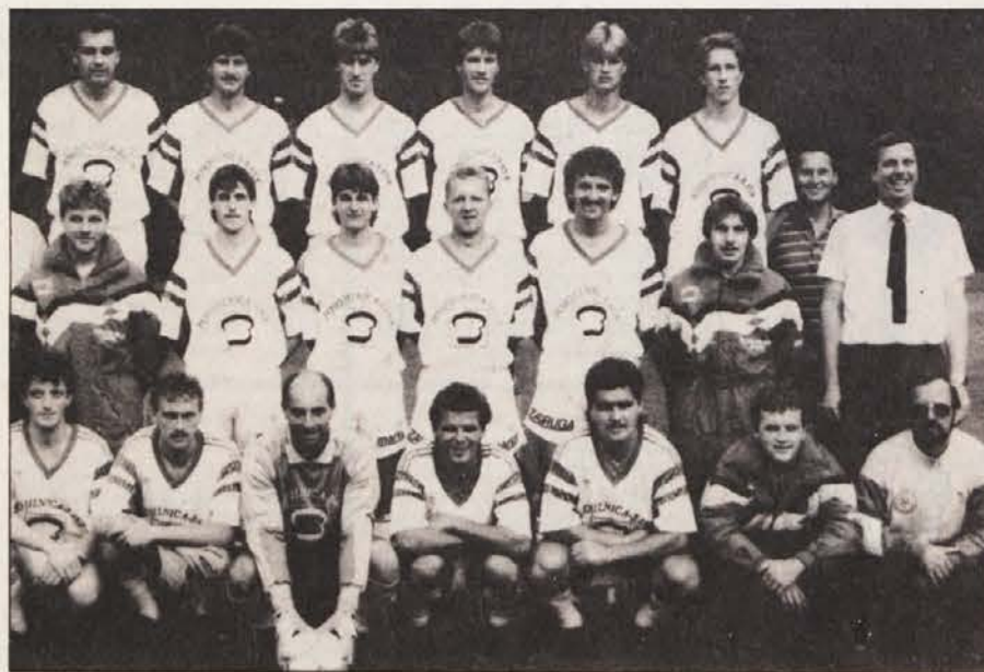
Ekipa Železne Kaple, ki je letos prav gotovo med resnimi kandidati za napredovanje v spodnjo ligo.