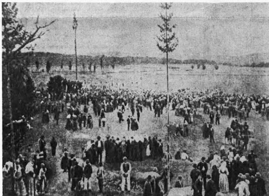
Slika je izpred sto leti in prikazuje šempaski tabor, to je množično zborovanje na prostem, da so javno zahtevali naj se Slovencem prizna narodnostno enakopravnost

Ljutomerski tabor predstavlja torej prvo, mogočno manifestacijo slovenske nacionalne zavesti pred stotimi leti, lahko bi dejali, politično osveščenost naših ljudi, ki so takrat jasno, kot tudi na drugih podobnih taborih kasneje, odločno razbili pokrajinsko, skoraj fevdalno razcepljenost slovenskega ozemlja in jasno ter odločno zahtevali integralnost, nacionalno suverenost in združitev vsega slovenskega ozemlja v eni sami državi, kar se je zgodilo slabih sto let kasneje v socialistični republiki Sloveniji. Zato ni nič čudnega, če danes obhajamo stoletnico ljutomerskega tabora tako svečano, saj predstavlja prvo stopnico k naši državnosti in samostojnosti.