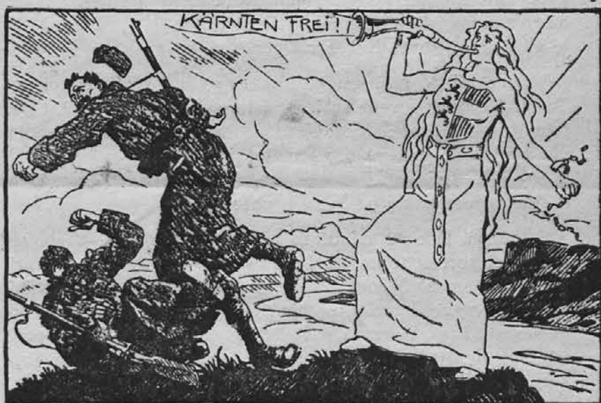
Koroška — od Pece pa gorta do Tur! Kdor take ne mara — čez Ljubelj so dur!

Ja, „sijajna“ je bodočnost Jugoslavije, „svetli dnevi“ čakajo njene otroke. Kaj ne?!