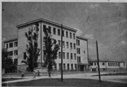
Poslopje III. drž. gimnazije

Z začetkom šolskega leta 1947/48 je bila po odločbi prosvetnega ministrstva na vseh šolah uvedena koedukacija, obenem so bili določeni šolam okoliši in jim dodeljeni dijaki-vozači; od teh so se mogli na III. gimnazijo vpisati le učenci, ki so se vozili po vrhniški progi v Ljubljano. Prvo leto se je vpisalo skoraj enako število učencev in učenk, fantov 308, deklet 302, skupaj torej 610. Približno isto razmerje je ostalo tudi v naslednjih letih. Tudi v notranjem ustroju šole so nastale precejšnje spremembe. Ker