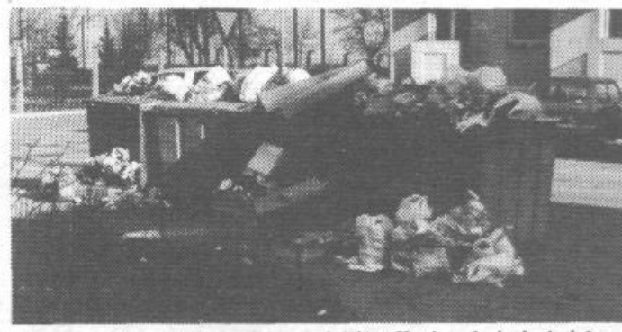
Deponija »prvomajskih praznikov« na križišču Kovinarske in Andrejaševe ulice kaže, da še nismo prav na dnu, ali pa morda ravno to.