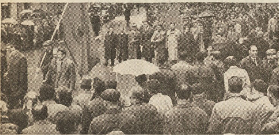
Letošnji I. maj je bil borben dan tržaškega proletariata, dan borbe za delo, za obnovo tržaškega gospodarstva za politične, socialne in narodnostne pravice prebivalstva Tržaškega ozemlja. Na sliki: delavci velikih industrijskih podjetij v sprevodu