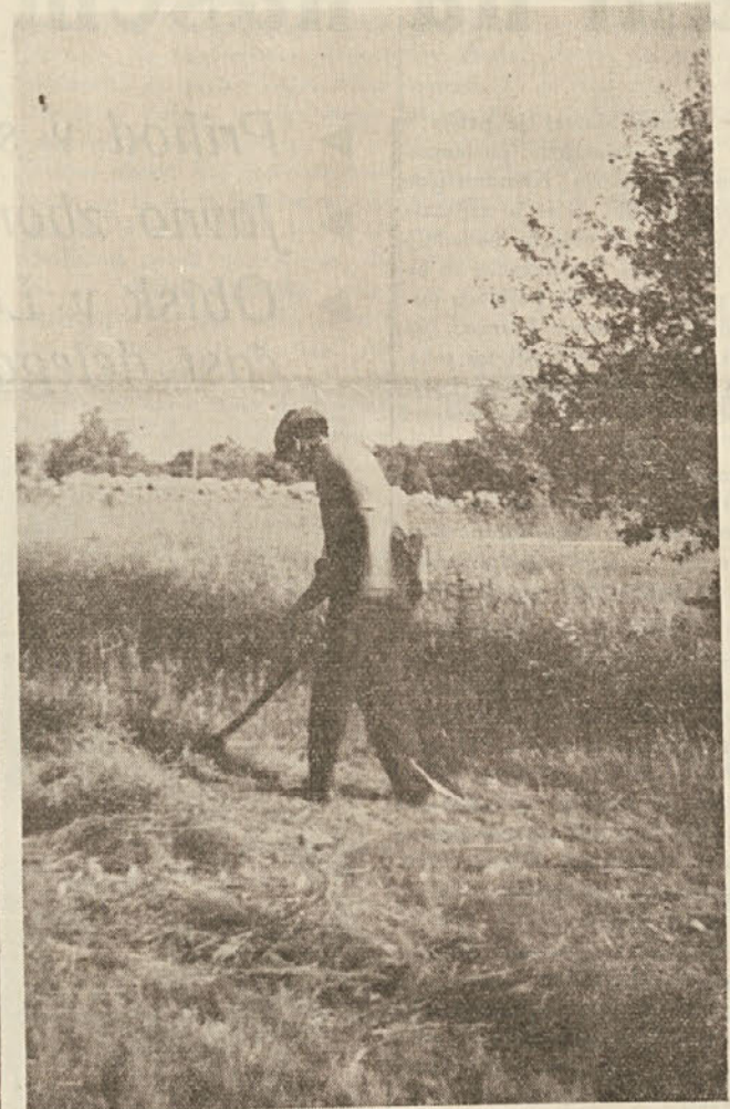
Nekoč so bili na Hudem letu lepi travniki, last kmetov iz Lonjerja. Bivša ZVU je te travnike spremenila v igrišče za golf. Lonjerski kmetje so bili s tem močno prizadeti. Sedaj jim primanjkuje krma. Se vedno čakajo na pravično odškodnino

Evo, zakaj zahtevamo uveljavitev zakona o hribovitih področjih tudi na Tržaškem ozemlju. Z uveljavitvijo tega zakona bi pripomogli k temu, da bi se naše kmetijstvo opomoglo in izboljšalo in bi bilo na splošno deležno vseh onih ugodnosti, ki jih to kmetijstvo nujno potrebuje. Se več: našim kmečkim ljudem je treba omogočiti, da se tudi strokovno pripravijo na svoj poklic. To velja zlasti za mlada pokolenja. Zato naj se čimprej uresniči toliko pričakovana in povsem upravičena zahteva po ustanovitvi kmetijske strokovne šole v Zgoniku, za kar se že vrsto let zavzema tamkajšnja občinska uprava, na kar je opozoril parlament tudi naš poslanec Vidali.