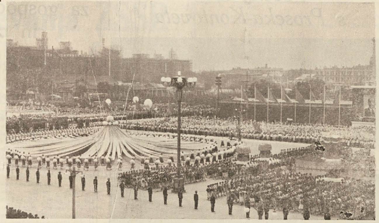
I. maja je bila v Pekingu veličastna mladinska parada, na kateri je sodelovalo na tisoče mladincev in mladink iz vse Kitajske. Na sliki vidimo prekrasn prizor, ki je bil posnet med omenjeno paradjo