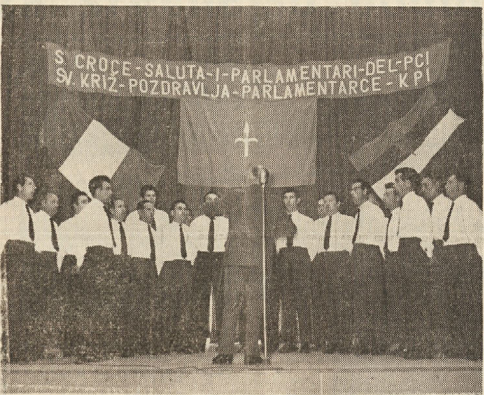
Kakor poročamo na drugem mestu, je bil v nedeljo popoldne pevskogodbeni koncert v Ljudskem domu v Krizu. Nastopili so zbor iz Saleža-Zgonika, Proseka-Kontovela in Ricmanj ter duet iz Podlonjerja. Sodelovala je tudi godba iz Kriza. Celotna prireditvev je zelo lepo uspela