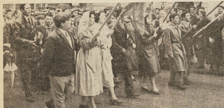
Mladina — naš up in naša bodočnost! Letošnje prvomajske manifestacije se je udeležilo mnogo mladine, ki je manifestirala za pravico do dela in učenja, za srečnejšo bodočnost in za mir. Tržaška mladina hoče na rodni zemlji ostati, se učiti in delati!