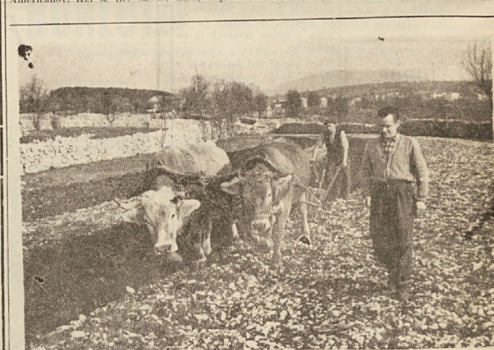
Površina orne zemlje se je v zadnjih desetletjih močno zmanjšala. Na njivah, ki so bile last kmetov z Brega so zgradili takomenovano industrijsko cono, na njivah pri Padričah pa begunsko naselje. Oblasti so prisilno razlitale tudi številne kmete iz Banov, Opčin, Proseka, Briščkov in drugih vasi

Toda to še ni vse. Kar je kmete še posebno ogorčilo, je odgovor, ki ga je dal ministru Andreotti našemu poslancu tov. Vidaliju na njegovo interpelacijo glede priznanja in izplačila skode. Minister Andreotti je odgovoril, da je bila vsem kmetom, razen enemu, že izplačana odškodnina, kar pa ni res. Kmetje so res prejeli odškodnino toda samo za škodo, ki so jo povzročile pred leti anglo-ameriške okupacijske sile na njihovih zemljiščih. Italijanska vlada je dejansko izplačala denar Anglo-Američanom. Kar se tiče skode