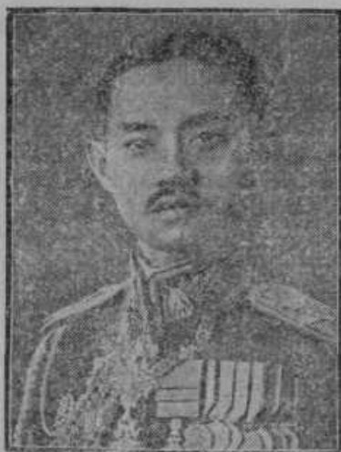
Kralj Siama, 39letni Prajadhipok, ki je dal državi vsled pritiska nekrvave revolucije ustavo.