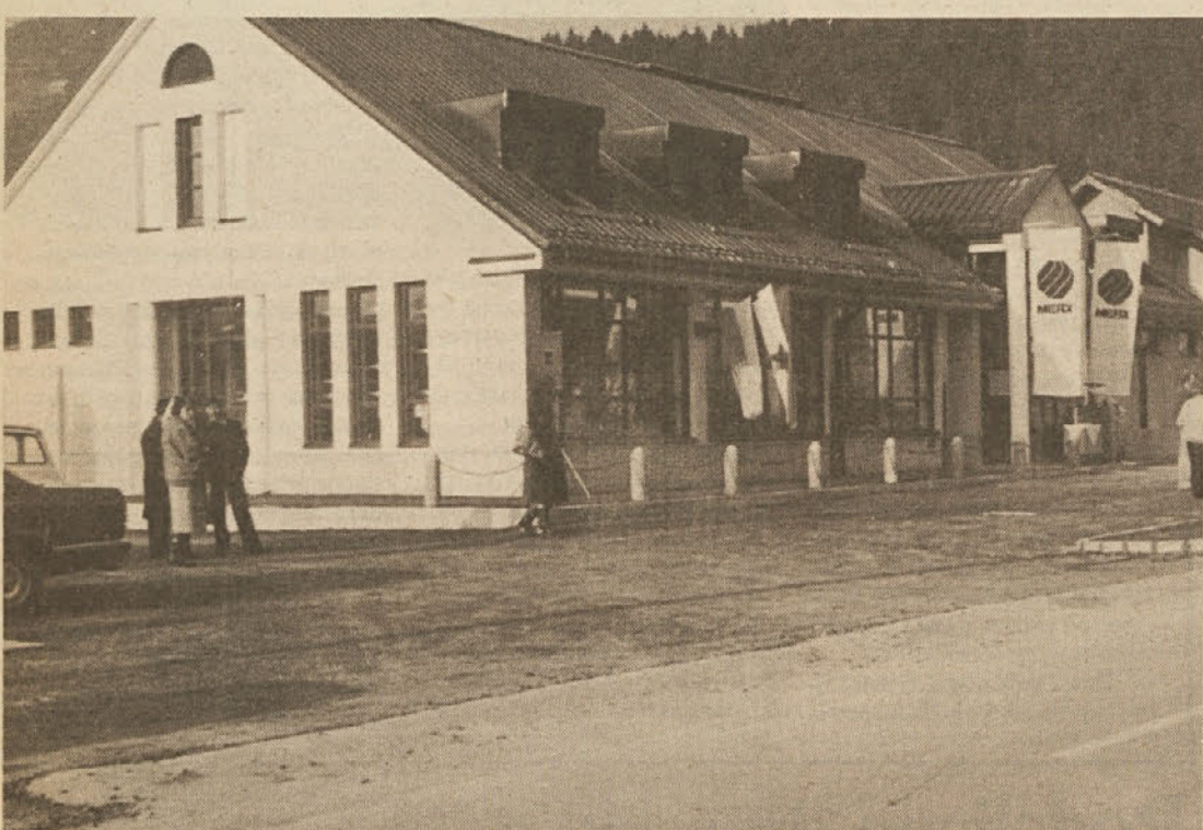
Kmetijska zadruga Slovenske Konjice je odprla v Zrečah novo trgovino, kar je bilo za prebivalce okoliških vasi pa tudi Zrečane same kar majhen praznik. Zunanost nove trgovine se lepo ujema z okoljem.