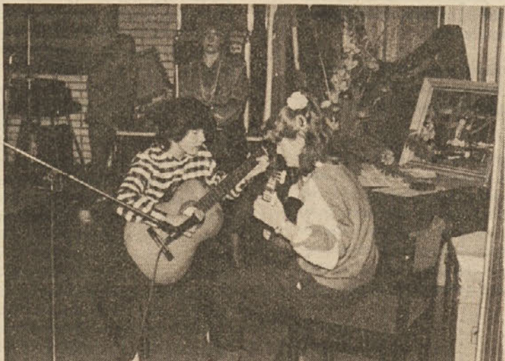
V kulturnem programu sta sodelovali učenki glasbene šole