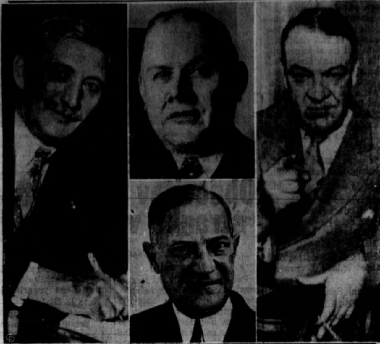
Na levi na tej sliki je Wm. Knudson, predsednik General Motors kompanije; na vrhu v sredi je William Green, predsednik A. L. of L., pod njim je senator Robert Wagner, predsednik odbora NRA za reševanje industrialnih sprovov; na desni je Hugh S. Johnson, načelnik NRA. Wagner in Johnson sta skušala pridobiti Knudsona in druge avtne magnate za pogajanje z zastopniki A. F. of L.