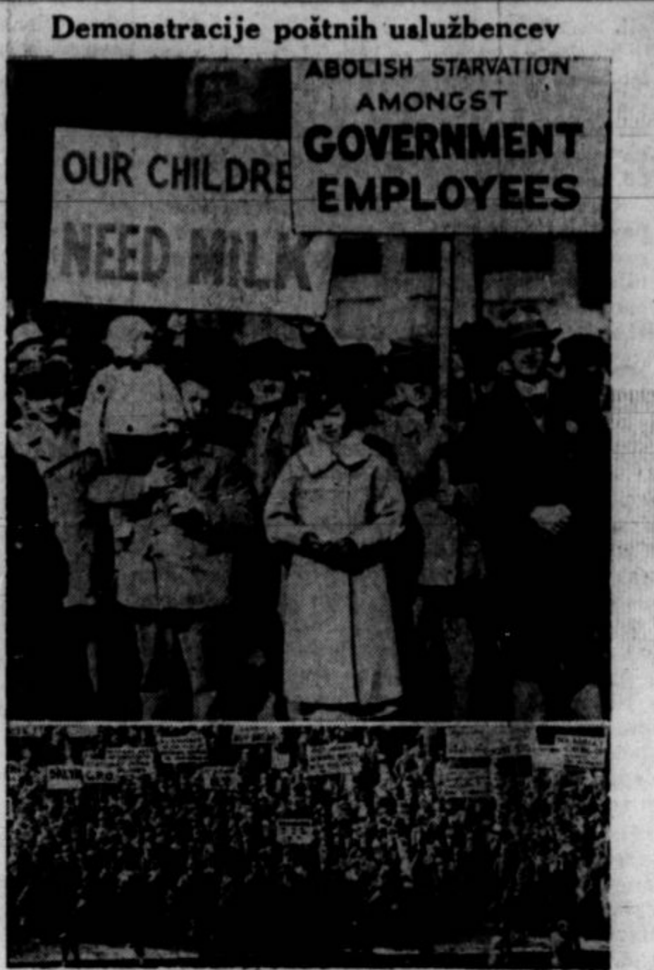
Osem tisoč poštnih delavcev v New Yorku, ki so na tej sliki, je demonstriralo proti odločitvam in znižanju plač. Prizadeti so največ takozvani nestalno zaposleni poštni uslužbenci. Predsednik Roosevelt jim je skoci časopisje odgovoril, da naj bodo veseli, da vsaj nekaj zaslužijo, kajti ako bi se poštna uprava poslužila trgovskega pravila ekonomije, bi morala te odsvoliti delavce odsvoliti. Demonstracija poštnih uslužbencev so se vršile tudi v Chicago in drugih velikih mestih.

Špijonaža je staro sredstvo imperijalističnih in kapitalističnih vlad. Ker ne zaupajo druga drugi, si iščejo s špijoni tajnosti o načrtih, o nakanah, utrdbah in sploh o vsem, kar jim bi utegnilo koristiti v slučaju konflikta.