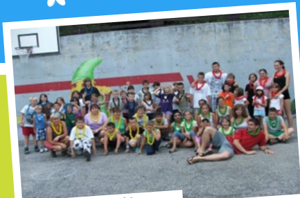
... ponosni in