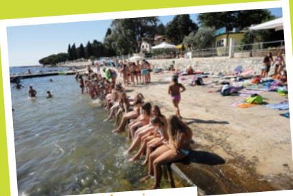
kopanje, plavanje ...