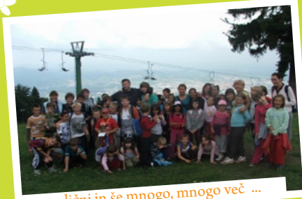
različni in še mnogo, mnogo več ...